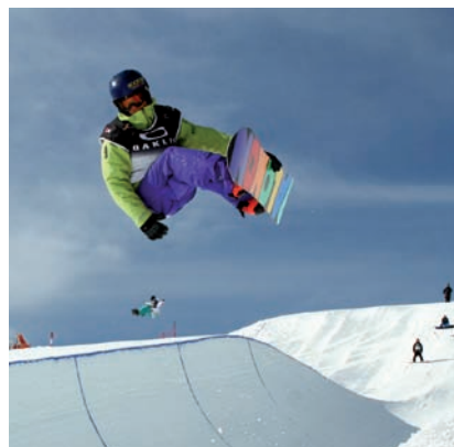
LA MOLINA 2011

>> Campionats del món de surf de neu. La Molina, gener de 2011.