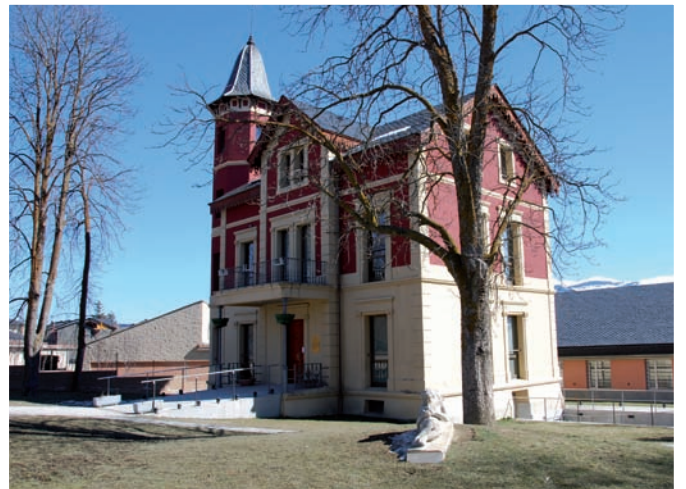
>> Escola Municipal de Música Issi Fabra, a Puigcerdà.

Issi Fabra és un dels músics catalans del s. XX que més han destacat en la música dedicada al ball i a la revista