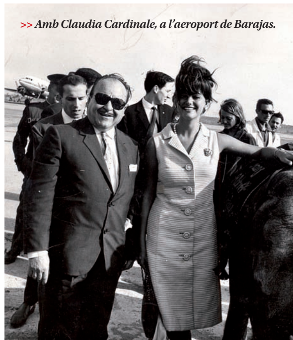
>> Amb Claudia Cardinale, a l'aeroport de Barajas.