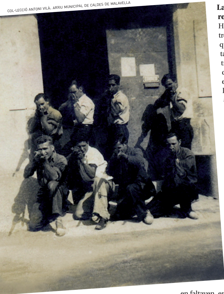
>> Milicians a Caldes de Malavella.