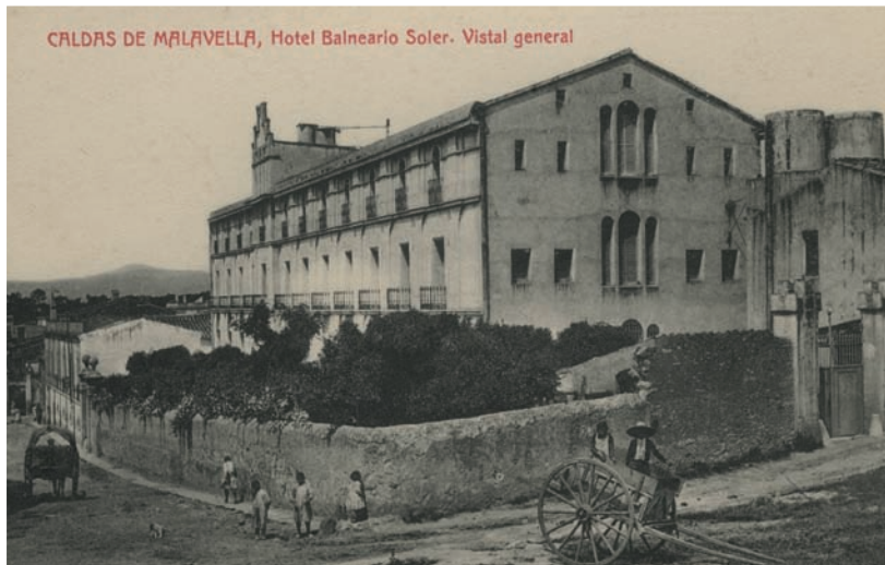
CALDAS DE MALAVELLA, Hotel Balneario Soler. Vista general