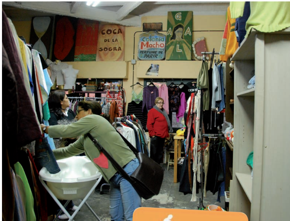
>> Interior de la botiga de segona mà d'El Trampolí.