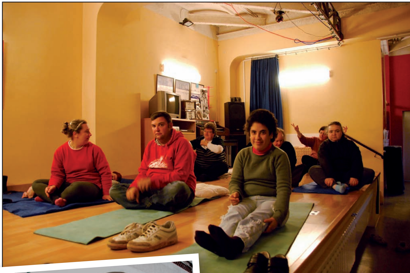
>> A dalt, una classe de ioga i a l'esquerra, l'entrada a la botiga d'El Trampolí a la Bisbal d'Empordà.