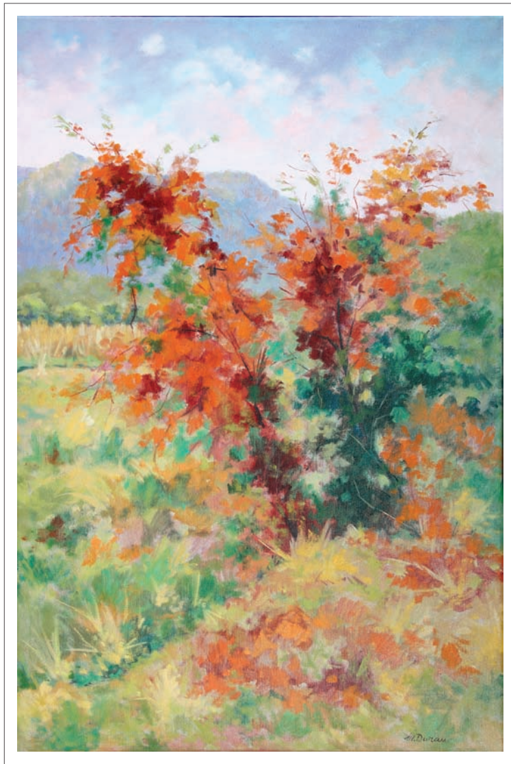
Arbust. 2005. Oli sobre tela. 81 x 54 cm.

buixar model nu femení, i comenta que ho fa periòdicament, és part desconeguda de la seva obra, i altres gèneres pictòrics, com els bodegons, són molt minoritaris en la seva producció. Guarda amb reverència els trofeus i els reconeixements, que té repartits sobre els mobles de casa seva, i té a disposició nostra la tirallonga de guardons que ha obtingut, de les moltes exposicions on ha participat i de les publicacions que han parlat d'ell. L'ordre del seu estudi, que deia a l'inici, es veu igualment en els seus papers i en el seu dia a dia.