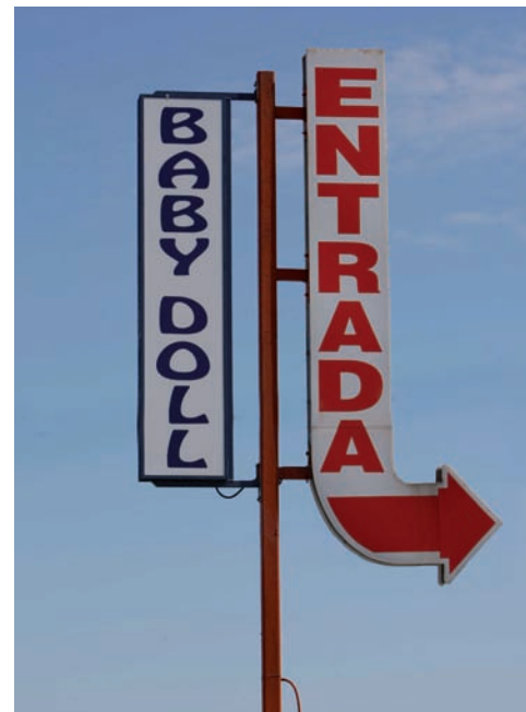
>> El Club Baby Doll, de Siurana.

tots els pisos són iguals. Miquel M. explica que n'hi ha que acumulen moltes més noies, portades des de països de l'Est i obligades a canviar de local cada tres setmanes. Hi afegeix que això és una excepció, ja que la majoria de dones, i també homes, que es dediquen a la prostitució ho fan per voluntat pròpia. Abunden també les que actuen de forma individual i prèvia cita concertada.