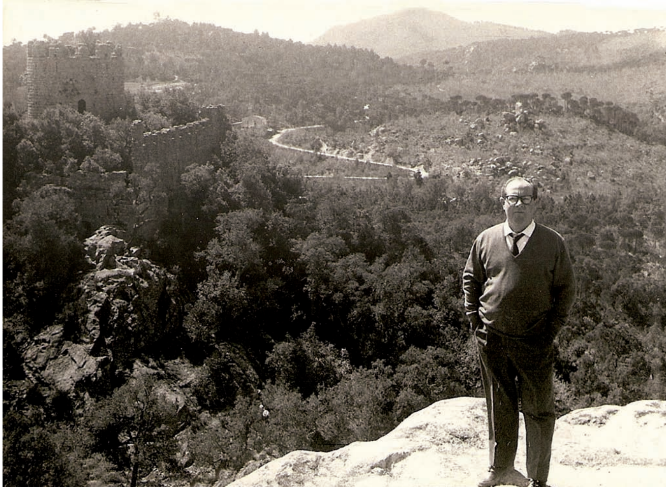
>> Vinyoli, dalt del turó del Vent, a Santa Coloma, l'any 1965.

porta el seu nom, i no gaire lluny dels camins, de la riera i dels boscos d'alzines sureres, elements tan vinculats a aquella descoberta iniciàtica.