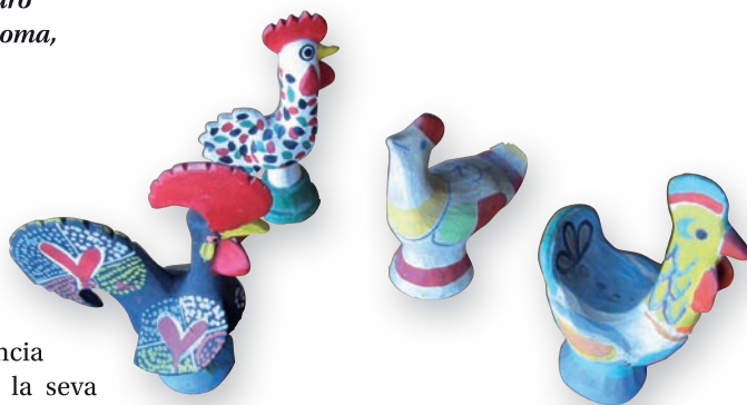
>> Galls de la col·lecció del poeta.

L'Espai Vinyoli hauria d'oferir al visitant, de qualsevol edat, l'experiència d'entrar en l'univers de la seva poesia per les vies intel·lectual, emocional i sensorial. Amb els recursos audiovisuals i plàstics necessaris, a l'espectador, a més de poder conèixer les dades biogràfiques del poeta i les bàsiques de la seva obra, li haurien d'«arribar» la temàtica dels poemes,