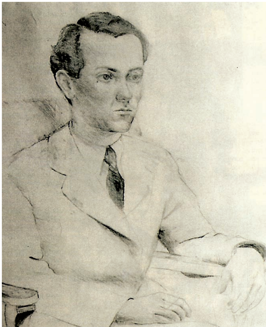
>> Joan Vinyoli. Retrat de Josep M. Sostres datat l'any 1937.