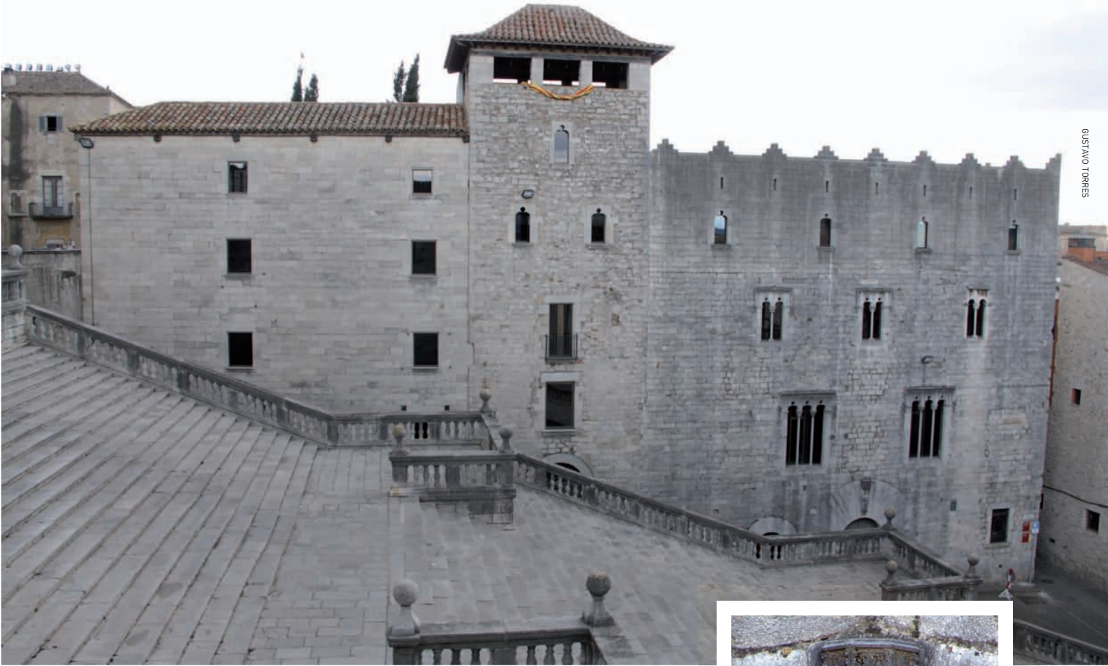
>> A dalt, la Pia Almoïna. A la dreta, Mare de Déu de la Pia Almoïna (s. xv).

2007, p. 85), «cap a la fi del segle XIX, una vegada fracassada la implantació de la beneficència estatal, aquesta passa a ser tutelada pels ajuntaments a fi d'evitar aldarulls i revoltes socials. En aquesta època sovintegen les olles públiques, les cuines municipals per tal d'apaivagar la gana i les deficients condicions de vida de les classes urbanes més necessitades, la majoria sense treball ni cap altra mena d'auxili. Una Llei d'Associacions de 1887 va fer créixer enormement el nombre de congregacions religioses assistencials: Germanetes dels Pobres, Germanetes dels Ancians Desemparats, Filles de la Caritat, Germans i Germanes de Sant Joan de Déu, Adoratrius del Santíssim Sagrament... i a nivell seglar les Conferències de Sant Vicenç de Paül com a més importants (creades l'any 1833 a París, s'estenen ràpidament), però també Associacions Parroquials, Juntes de Senyores, Dames de Caritat [...]». Fracassada la beneficència estatal, inoperant la provincial, el municipi serà el vertader protagonista de la bene-