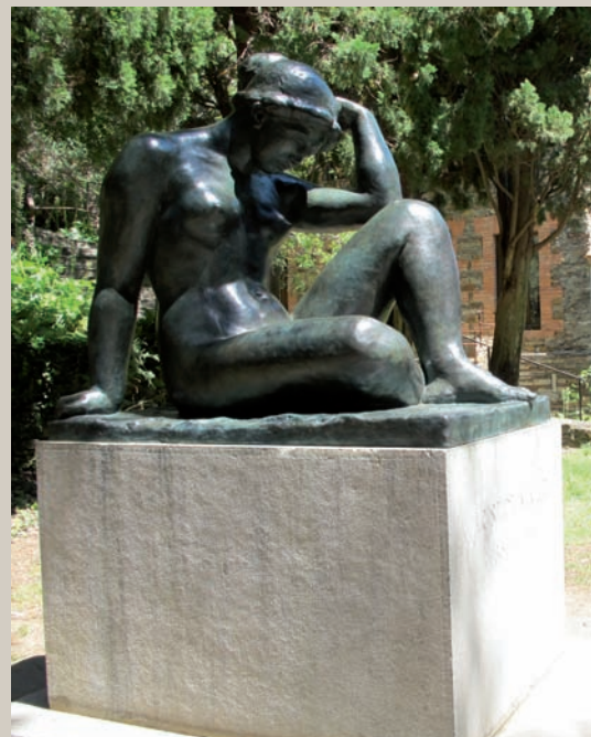
>> Reproducció de La Mediterrània sobre la tomba de Maillol.