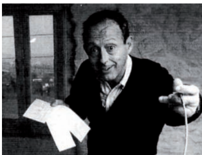
AUTOBRETAT — XAVIER MISERACHS

Vaig escriure aquestes notes el març de 2006, en una visita que vaig fer-li a casa seva. Em fascinaven tant el fotògraf com les seves fotografies. Cada dos anys els membres de la Biennal Miserachs lluiten per tal d'aconseguir del nostre país el criteri que esmentava Miserachs i exposen. I és cert que cada dos anys l'esforç representa un pas endavant. I això, no hi ha dubte, hauria complagut Xavier Miserachs, el fotògraf, el gran fotògraf.