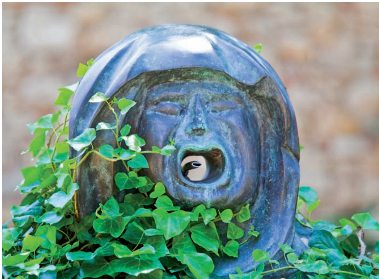
El crit de la bruixa , 2005, bronze, (Jardins de la Francesa, Girona), 60 x 55 x 25 cm.