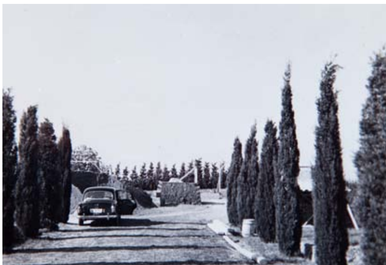
FUNDACIÓ PRIVADA NICOLAU RUBIÓ I TUDURÍ