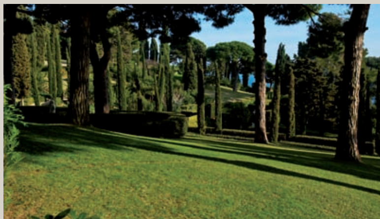
>> Jardins de Santa Clotilde, a Lloret de Mar.