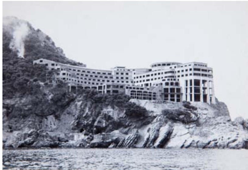
FUNDACIÓ PRIVADA NICOLAU RUBIÓ I TUDURÍ

El jardí busca emmarcar la casa al capdamunt del pendent mitjançant una avinguda central de xiprers. La presència dels xiprers –avui dia encara més imponents–, per bé que gens aliena a la filosofia paisatgística de Rubió, podria haver estat potenciada per l'ús que ja n'havia fet el matrimoni Woevodsky a Cap Roig, que va ser lloat