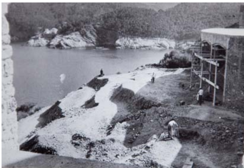
FUNDACIÓ PRIVADA NICOLAU RUBIÓ I TUDURÍ

Un altre exemple de la dinàmica d'aquest patrimoni fràgil és l'enjardinament del castell de Vulpellac. L'històric castell dels Sarriera, adquirit el 1962 pel banquer Domingo Valls Taberner (1907-1978), va ser restaurat per l'arquitecte Ramon Duran Reynals en una intervenció costosa per l'època i que devia incloure la creació del jardí, encarregat a Rubió per l'amistat històrica i l'afinitat estètica que l'unia amb l'arquitecte. Però Do-