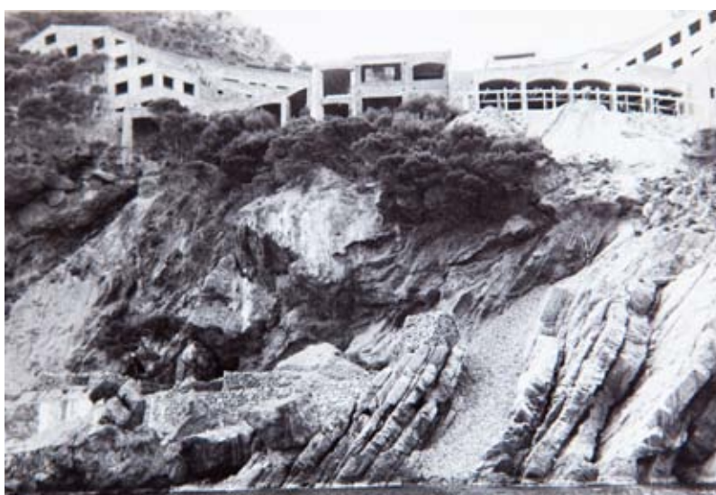
FUNDACIÓ PRIVADA NICOLAU RUBIÓ I TUDURÍ

>> De dalt a baix, grans moviments de terra en la construcció de Cap sa Sal, per reconfigurar la natura sense artifici aparent; la gran avinguda de xiprers, similars als de Cap Roig, per a la finca d'Eduard Rosa, a Calella, i jardins de Cap sa Sal, a Begur.