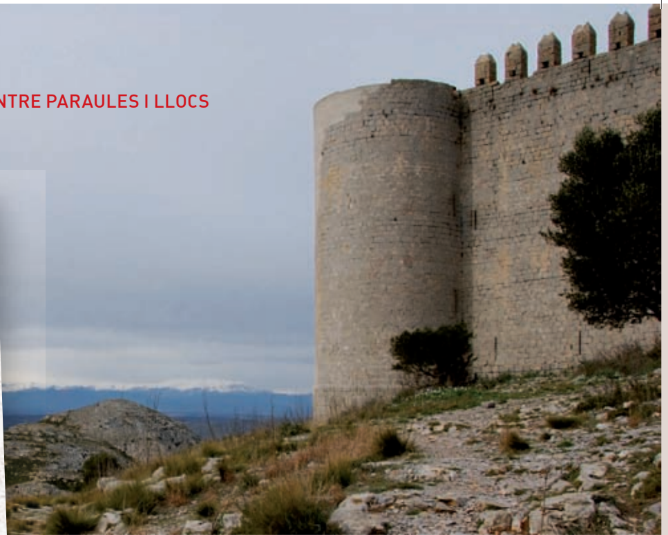
>> El castell del Montgrí i detall de la placa dedicada a Víctor Català que hi ha a l'ermita de Santa Caterina.

a formes dialectals com estornuc , marfir , dòs (doncs) , goita , gènit . Més d'un segle després que es publicà el llibre, encara tinc amics i parents que les fan servir, cosa que m'omple d'una alegria una mica pueril.