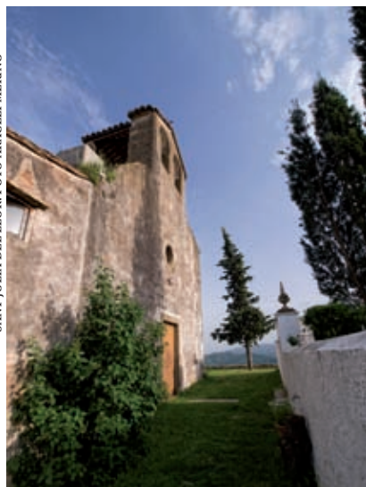
SANT JULIA DEL LLOR.

Potenciació del patrimoni | Amer, per la part selvatana, fou l'escenari de la presentació del tríptic editat per l'Arxiprestat del Ter-Brugent, que agrupa els consells parroquials de la zona que banyen aquests cursos fluvials. Més que la presentació –portada a terme en aquest lloc perquè és un dels que tenen més història–, interessa la idea de divulgar la situació i el passat dels monuments religiosos del voltant de l'antiga ruta del