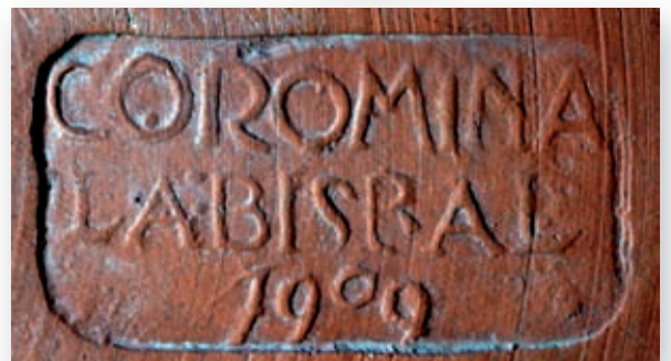
>> Plata imitació de cerámica àtica i segell «COROMINA / LA BISBAL / 1909» (col·lecció particular).

cediments d'elaboració: de goig perquè habèm pogut observar que la rutinaria indústria cerámica bisbalenca, [...] ha adquirit un grau de perfeccionament y un caràcter decoratiu y artístich embejables. L'amich Corominas, [...] ha ob-