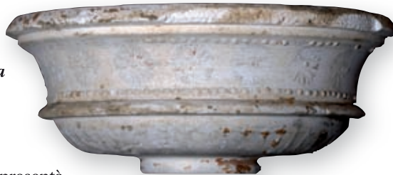
AUTOR: JOAN COROMINA PUJOL. TERRACOTTA MUSEU (FONS COROMINA).