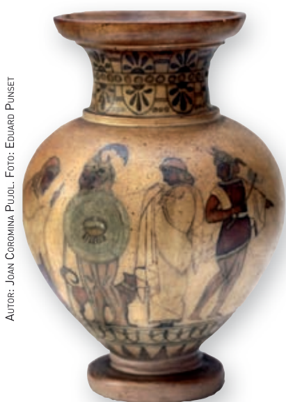
AUTOR: JOAN COROMINA PUJOL.

JOAN COROMINA PUJOL, PROFESSOR DE DIBUIX I CERAMISTA, ÉS L'ARTÍFEX DEL NAIXEMENT DE LA «NOVA CERÀMICA ARTÍSTICA CATALANA»