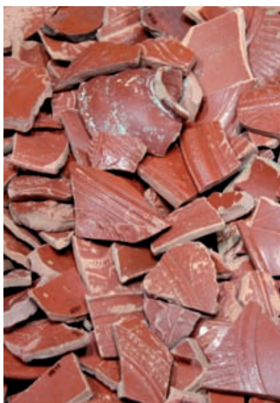
>> Terra sigil·lada sud-gà·lica.

aplicació a la ceràmica y a lograr el seu noble y desinteressat propòsit ha sacrificat anys y més anys y bona part dels fruits materials del seu treball [...] No es, donchs, en Joan Coromina un teòrich; és un mestre teòrich y pràctich tot d'una pessa, qu'ajuntant aquestes dugues condicions està cridat a exercir una influencia decisiva, en sentit progressiu y veritablement artístich, sobre l'industria ceràmica bisbalenca».