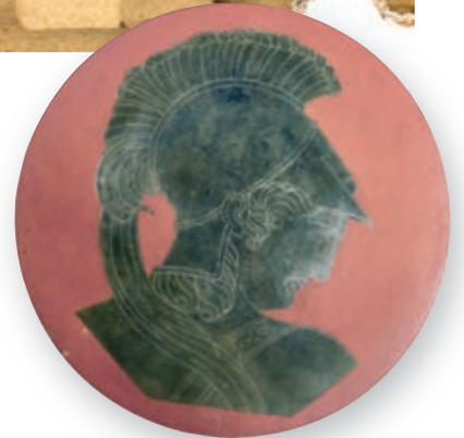
AUTOR: JOAN COROMINA PUJOL (1909).

Van haver de passar gairebé 20 anys perquè els esforços de Corominas es veiessin coronats finalment per l'èxit