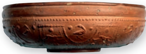
>> Vas imitació terra sigil·lada sud-gàl·lica decorada (col·lecció particular).