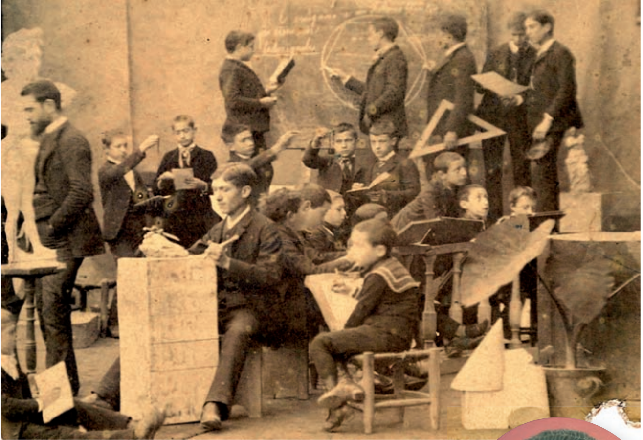
>> Una classe a l'Escola Menor de Belles Arts, cap a 1910.

li serviren com a font d'inspiració i model per a les seves reproduccions.