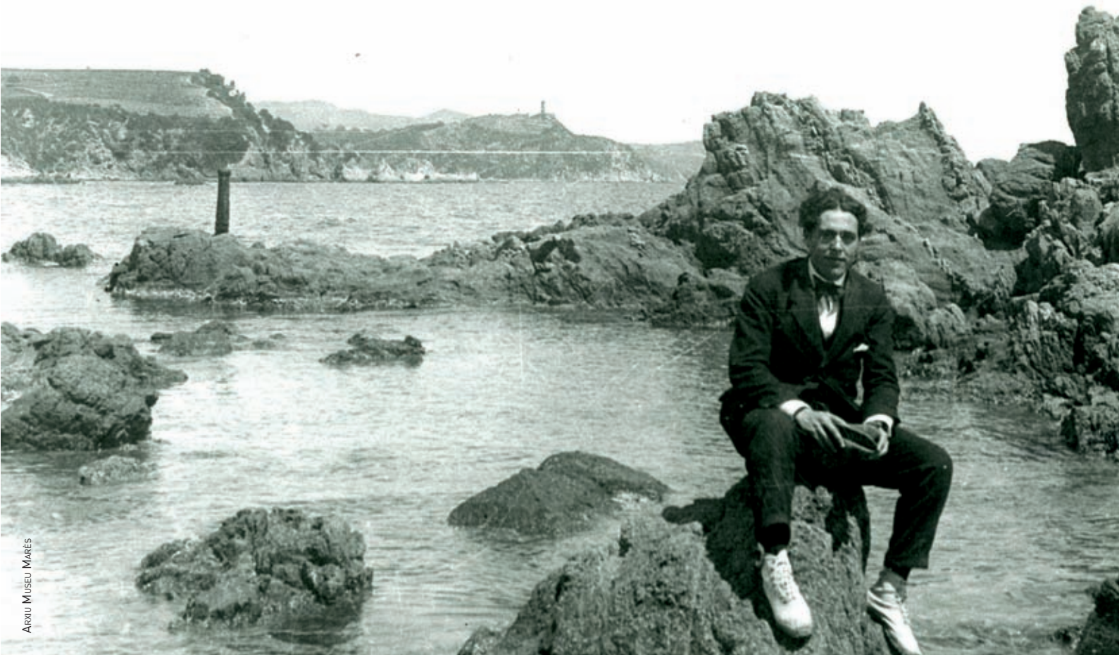
>> Frederic Marès a la cala de Santa Cristina de Blanes, el 1921.