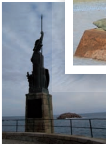
Tossa de Mar, platja gran: Minerva (1974)