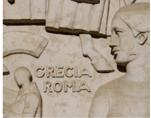
>> A dalt, fris i detall dels relleus de Frederic Marès a la façana del Museu de l'Empordà, a Figueres. A sota, detall i fris de Frederic Marès a l'edifici de Correus de Girona (1922).