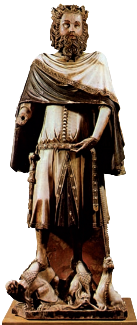
>> Carlemany, escultura gòtica de la catedral de Girona.

L es llegendes són un element de la cultura popular que han estat importants en la transmissió del coneixement en general. Podríem definir la llegenda com un relat que té el seu punt de partida en un esdeveniment històric però que s'amplifica i modifica amb altres materials i dóna com a resultat una narració que té poc a veure amb la història objectiva. La figura de Carlemany és ben coneguda a Girona i al nord de Catalunya, on abunden llegendes de marcat caràcter popular sobre fets que l'emperador va protagonitzar en aquestes terres, però amb un component fantàstic molt accentuat, que les fa poc creïbles als ulls crítics de la contemporaneïtat, en què s'ha tendit a escriure una història objectiva que ha anat desmuntant molts tòpics.