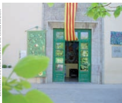
ESCOLA DOCTOR ROBERT DE CAMPRODON

no li pertoca un destí gaire diferent. L'allau de visitants que envaeixen les llibreries i la munió de badocs que s'apleguen a l'entorn de les paradetes podrien fer suposar que vivim en un país de grans lectors, però és només un miratge.