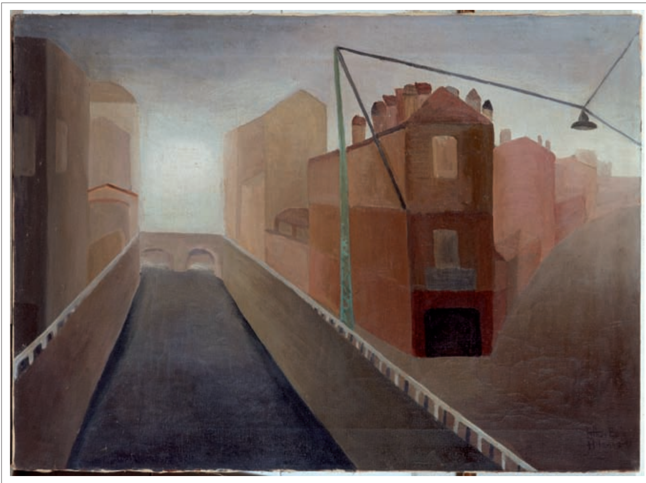
«Il Naviglio» de Milà. 50 x 60 cm. 1957. Oli/tela.