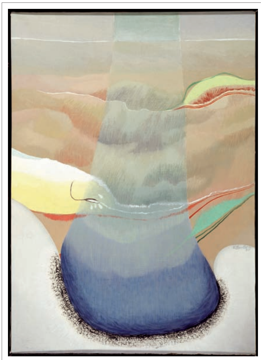
Gota de pluja (Sèrie Holanda). 82 x 65 cm. 1975. Oli/tela.

ropeu. Crec que aquesta peça té un altíssim valor poètic, que s'ajuda de l'expressió amb colors poc densos, fredos, i el predomini de pinzellades petites i fibroses.