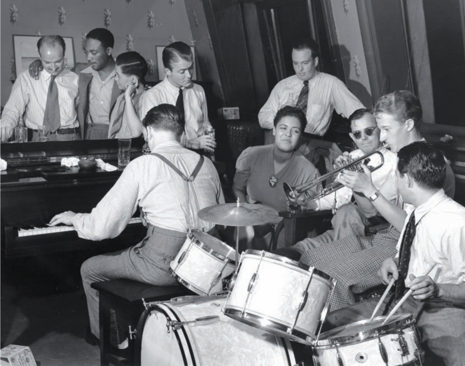
>> Artie Shaw, a dalt a l'esquerra, amb la seva banda i la cantant negra Billie Holiday.