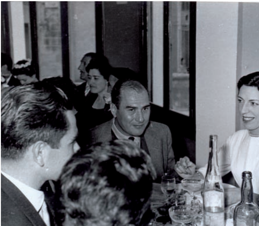
>> Artie Shaw, durant la seva estada a Begur.

guió d'una pel·lícula que mai no es va realitzar: Sardana for a Jazz Trumpet .