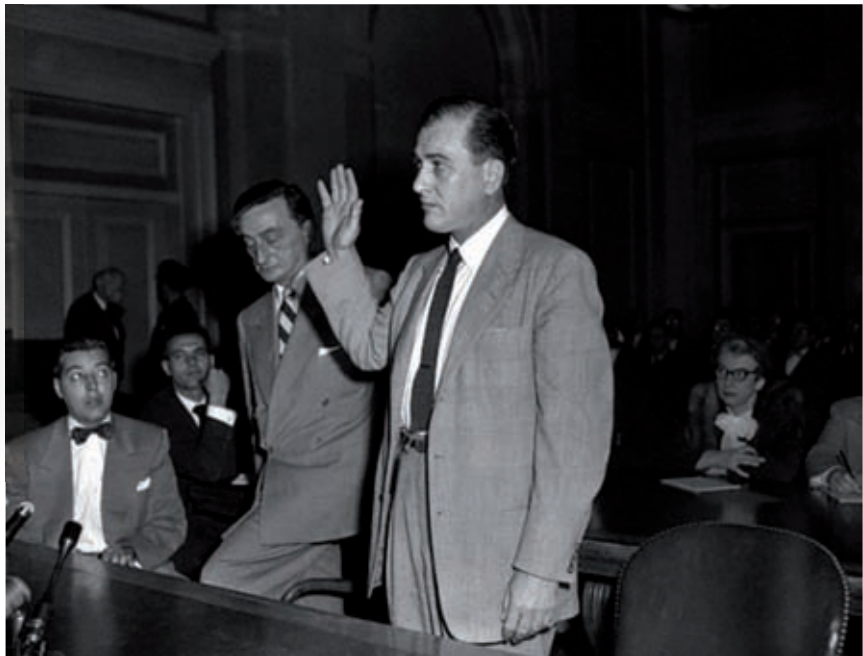
>> Artie Shaw declarant davant el Comitè d'Activitats Antiamericanes.

Durant la Segona Guerra Mundial s'allistà a la Marina i continuà tocant, de vegades sota l'estrèpit de les bombes i sovint amb la sensació que no podia fer res per ajudar el seu país. Va tornar de la guerra exhaust i psicològicament enfonsat, esclau d'una apatia que el portà a fer sessions de psicoanàlisi durant una temporada. Una vegada refet, va reprendre l'activitat amb el seu grup Gramercy Five, amb el qual podia tocar una música més experimental, que només al cap dels anys fou prou valorada per crítics i públic. Cada vegada s'interessava més per la música clàssica i per trobar noves perspectives musicals, i aquesta tendència sovint l'allunyava de les preferències del gran públic.