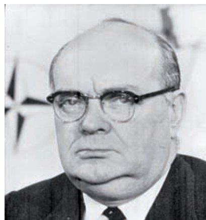
>> Paul-Henri Spaak.

L' estiu de 1940, moment de la invasió de Bèlgica per l'exèrcit nazi, Spaak, ministre d'afers estrangers, abandonà el seu país en companyia d'Hubert Pierlot, el primer ministre, i la família d'aquest darrer: muller i set fills, la criada i el cap de gabinet. La seva intenció era, com la d'altres polítics, intel·lectuals, etc., d'arribar a Londres, reducte democràtic en el combat contra Hitler, travessant França, Espanya i Portugal. Els belgues van arribar a Vichy, on acabava de constituir-se el govern francès controlat per Berlín, i, amb el temor de ser detinguts per la Gestapo, el 24 d'agost de 1940 van marxar; al vespre arriba-