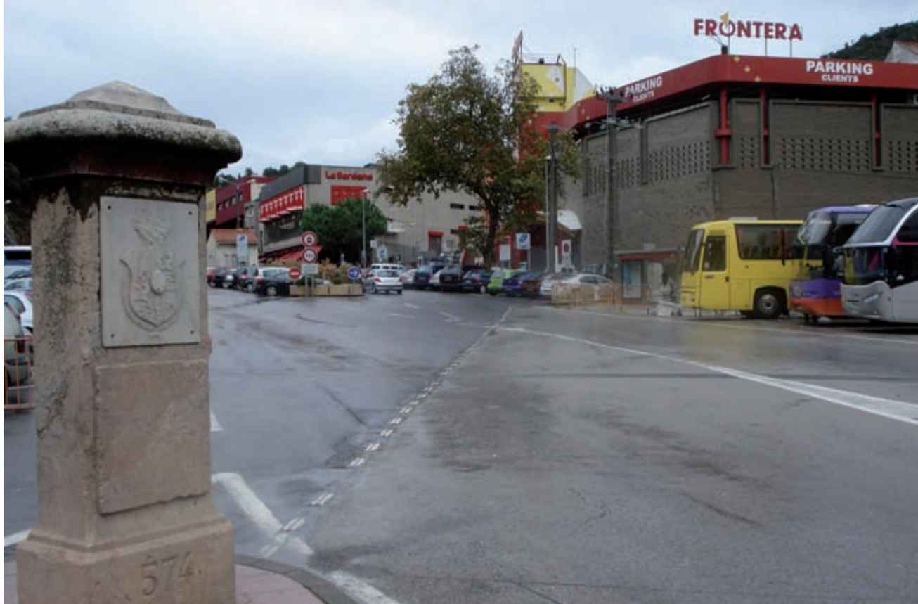
>> El Pertús.

dormir. Van passar dies i negociacions, però la mala voluntat espanyola no els permetia d'arribar més enllà: els alemanys acabaven de conquerir Bèlgica, Holanda, França..., el vent els venia de popa i la força de Berlín sobre Madrid era més poderosa que la de Londres. El cap de policia, avergonyit, els suplicà que tornessin a França perquè se la jugava; van negociar i acordar que es quedarien en terra de ningú entre les dues duanes, perquè tornar a França representava la detenció segura i probablement la mort. S'instal·laren al peu d'un monument a Franco que hi acabaven d'erigir, que de dia els feia ombra –era l'estiu–; de nit dormien a l'interior dels dos luxosos cotxes Packard que portaven. Bevien i es rentaven amb l'aigua d'una font, i menjaven de les provisions que Spaak havia previst de dur de la Jonquera. Entretant arribaren de Londres a Barcelona dos ministres més del govern belga foragitat pels nazis: Camille Gutt, d'Hisenda, i Albert de Vleeschouwer, de Colònies, per veure's amb Pierlot i Spaak; arribats a la Jonquera, amb la tolerància de les policies espanyola i francesa, es van reunir amb els seus col·legues en un despatx que hi havia en la no man's land per celebrar un consell de ministres. La constitució belga ho permetia si hi havia presents quatre ministres i