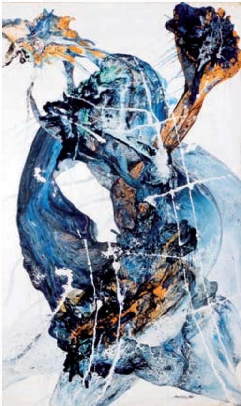
>> Silvà, 1961. Oli / tela. 195 x 114 cm.