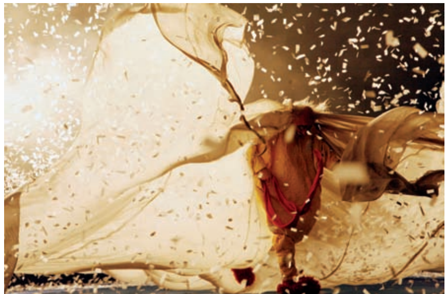
>> Slava's Snowshow.