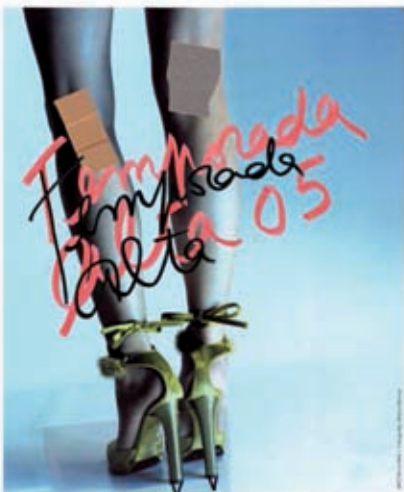
FESTIVAL INTERNACIONAL DE TEATRE GIRONA/SALT

Quant a la gestió, el Temporada Alta també és peculiar, ja que és l'únic de l'Estat espanyol que s'organitza com un festival de titularitat pública gestionat -i finançat en la seva major part- des de l'empresa privada. «Es tracta d'una iniciativa privada amb vocació de fer una cosa pública; això fa que cada qua-