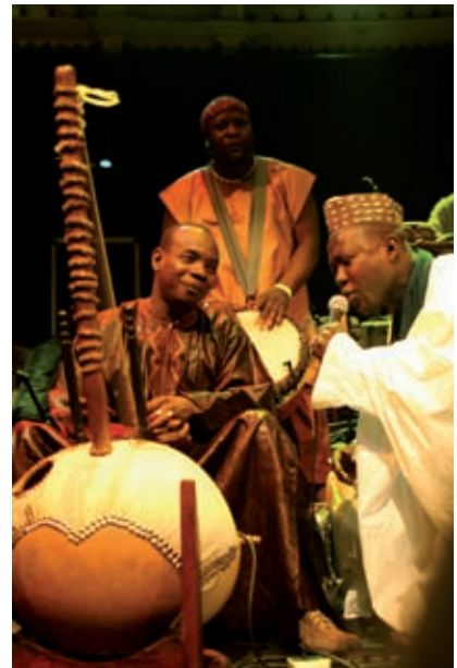
>> Toumani Diabaté.

ció anòmala, ja que la major aportació ens ve dels espònsors, seguits de la Generalitat i en tercer lloc de la venda d'entrades, cosa que no passa en cap altre festival. Per tant, jo crec que hi ha dues opcions: l'una, deixar-ho tot com està, amb la qual cosa el festival anirà tirant raonablement bé durant cinc o sis anys més; o bé, tenint en compte que, ara com ara, a Catalunya no tenim cap gran festival de teatre i sí molts de petits, plantejar-nos la possibilitat de tenir-ne un –jo, evidentment, votaria pel nostre– que pugui estar al costat dels d'Avinyó, Edimburg... és a dir, dins els cinc o sis grans d'Europa. Així, d'aquí a vuit o deu anys podríem tenir un gran festival i un important centre de creació/producció, la Coma-Cros, que ens podria fer créixer en tots sentits, ja que ens permetria assolir una certa capitalitat escènica gràcies a la qual tota l'àrea de Girona en podria sortir beneficiada. I ho crec perquè tinc diferents proves de la seva viabilitat. Veig que, artísticament, hi ha interès de part de diferents companyies no només per venir al festival sinó per estrenar i fins i tot instal·lar-se aquí. N'hi ha que ja ho han fet, i d'altres que ens ho han plantejat, però aquesta despesa nosaltres sols no la podem assolir. Crec que ara seria un bon moment per fer el salt definitiu i que el profit seria doble: