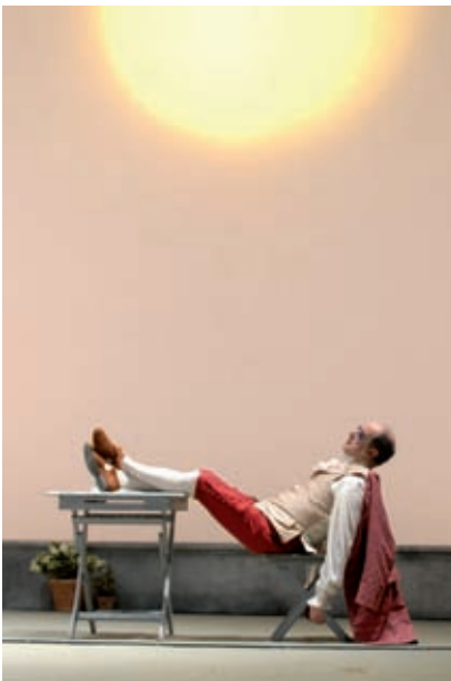
>> Trilogia della villeggiatura.

cici molt sa, perquè et situa i no et deixa caure en la temptació –quan les coses van bé, és clar– de creure que tot és magnífic i fantàstic, i tu també. És un bon estímul per millorar i superar-te contínuament».