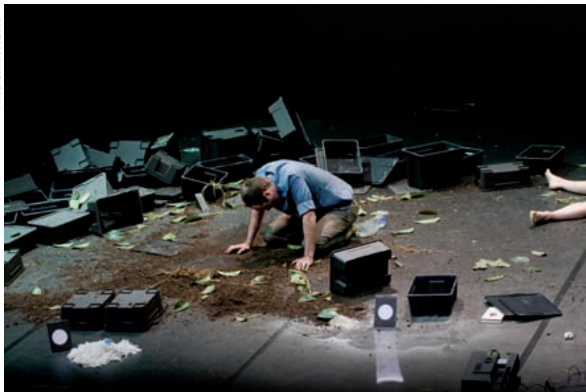
>> Contra Natura.

a llarg termini, sinó que era més aviat una cosa immediata, sense voluntat explícita de futur. I de fet és així com funcionem: cada quatre o cinc anys fem una valoració i ens plantegem com podem millorar».