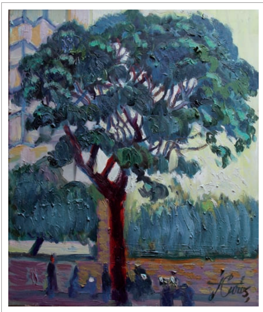
Pi de les Corts. 61 x 50 cm. 2009. Oli/tela.

escriure: «dibuja con trazos enérgicos que tienden a veces a la caricatura, a un expresionismo que confieso que casi me asusta», i quan només tenia vint anys li van proporcionar la possibilitat d'exposar individualment a Barcelona, a la galeria El Jardín, coneguda pel seu avantguardisme.