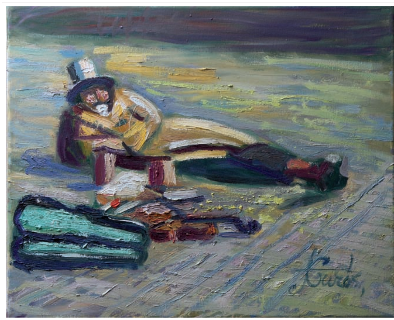
Rambles. 38 x 46 cm. 2009. Oli/tela.