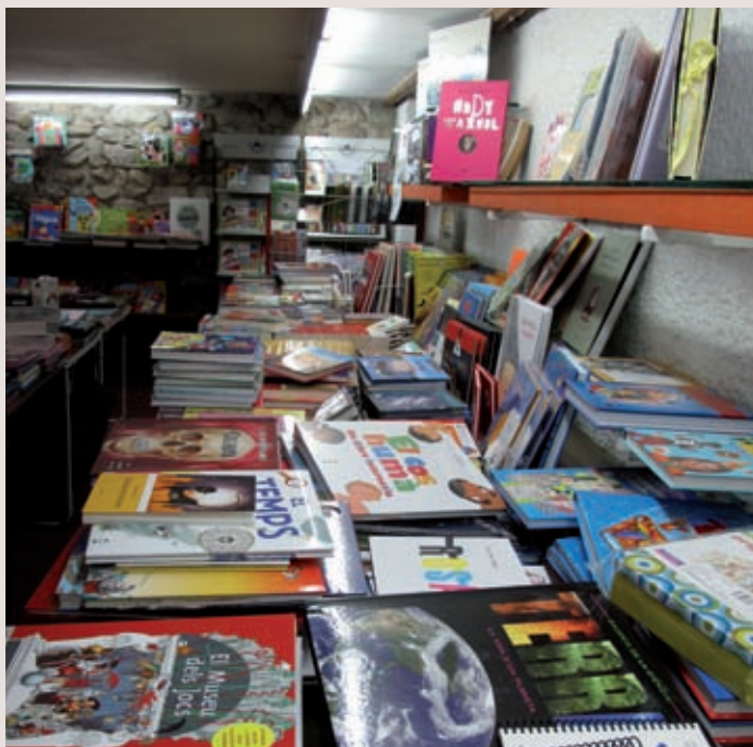
>> Imatge actual de l'interior de la llibreria Les Voltes.