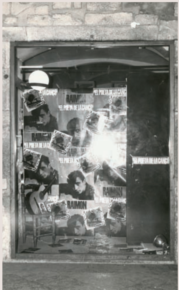
>> Aparador dedicat a Raimon, a final dels anys seixanta.