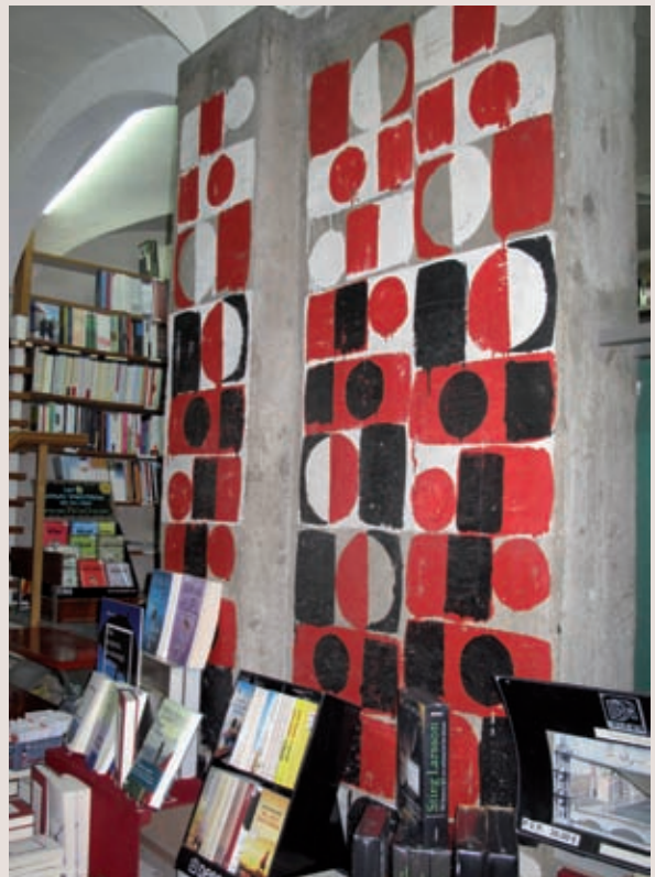
>> Mural pintat per Francesc Torres Monsó amb motiu de la inauguració de Les Voltes, l'any 1963.