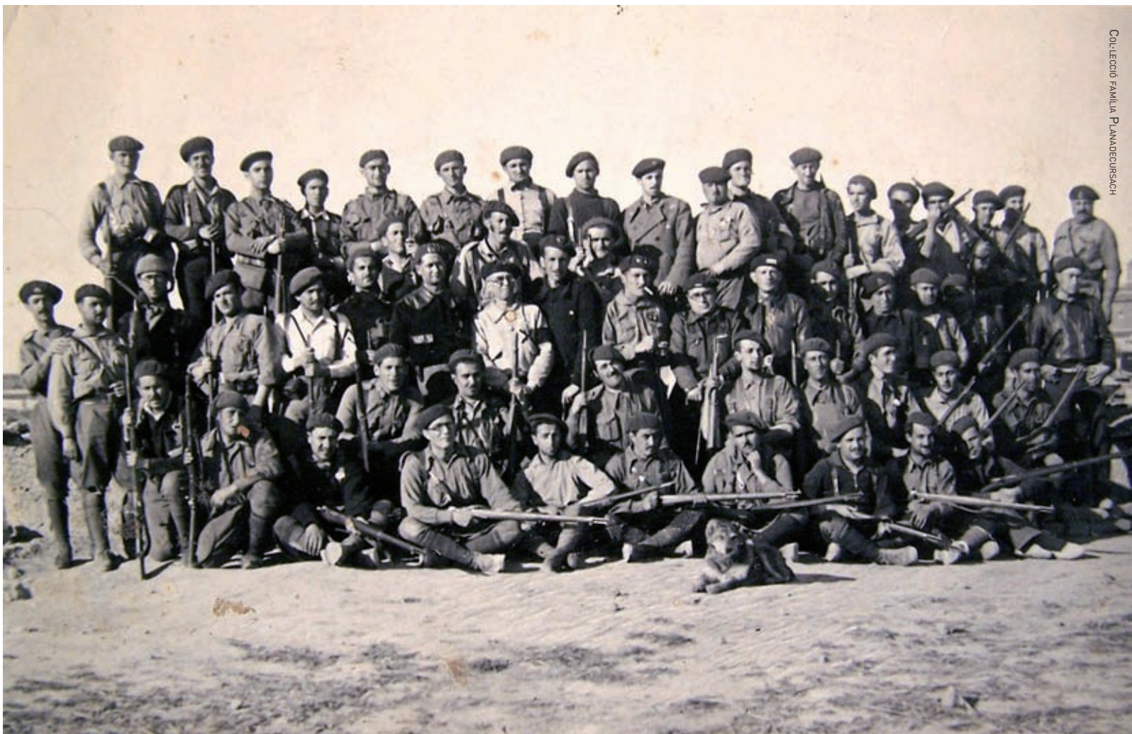
>> Companyia de soldats del Terc de Requetès de Nostra Senyora de Montserrat.