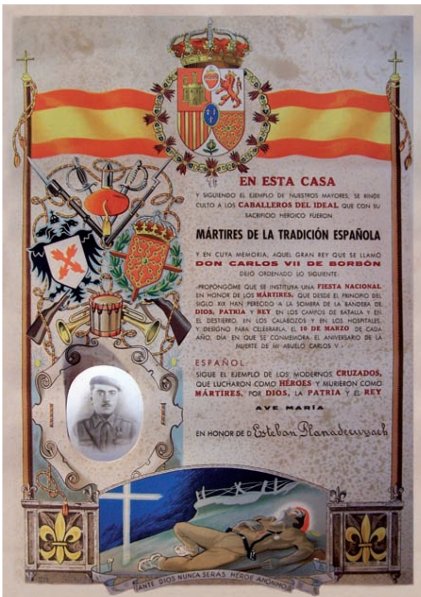
>> Diploma dels Màrtirs de la Tradició Espanyola atorgat a Esteve Planadecursach.

siempre preparado a cualquier eventualidad bélica». Per tant, la recompensa per l'esforç bèl·lic i fins i tot una possible entrada d'Espanya a la Segona Guerra Mundial requerien el manteniment del subsidi. La pervivència d'aquesta ajuda se sustentà amb recàrrecs de fins al 20% en molts productes aleshores qualificats de luxe, com les consumicions en bars i restaurants o els aparells de ràdio.