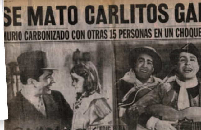
>> Diferents moments de l'accident d'aviació a Medellín, el 24 de juny de 1935.

fessor particular, tasca que l'obligava a no separar-se d'ell, per poder practicar constantment i aconseguir que Gardel adquirís amb el mínim temps possible el domini de l'idioma. El març de 1935 es programà una gira per Centre-amèrica (Puerto Rico, Veneçuela, Colòmbia, Panamà, Cuba i Mèxic), que permetria la promoció de les seves pel·lícules, però sobretot donaria temps al cantant per aprendre anglès. Això explica el fet que el bisbalenc Plaja també embarqués el dia 29 de març en un moll de Brooklyn per acompanyar Gardel i els seus guitarristes en la que va ser l'última gira.