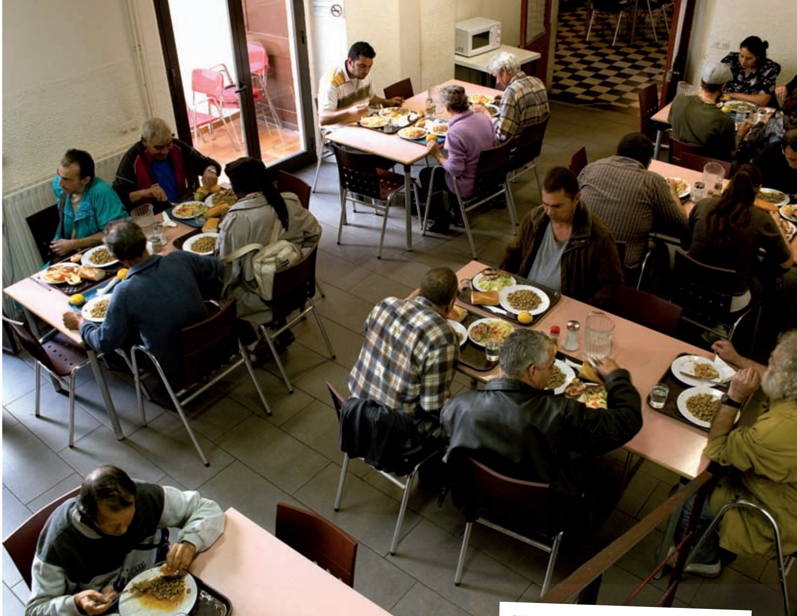
>> Un dels àpats diaris a La Sopa, sempre plens de caliu i activitat.

Sovint identifiquem la pobresa extrema amb casos de penúria material situats als marges o gairebé fora de l'estructura social. Tendim a pensar que les situacions d'exclusió són provocades pel baix nivell educatiu, la incapacitat o la idiosincràsia de les persones afectades, però poques vegades ens plantejem que la pobresa pot tenir causes estructurals i que pot ser producte del mal funcionament d'un engranatge que, avui més que mai, es fonamenta en un bé tan escàs com el treball. Tot i que el procés pel qual una persona acaba vivint al carrer acostuma a ser llarg i penós, complex i gens susceptible de ser reduït a uniformitzacions, sempre va lligat a una desvinculació del mercat laboral que, en general, té poc a veure amb les capacitats o els mèrits dels afectats.