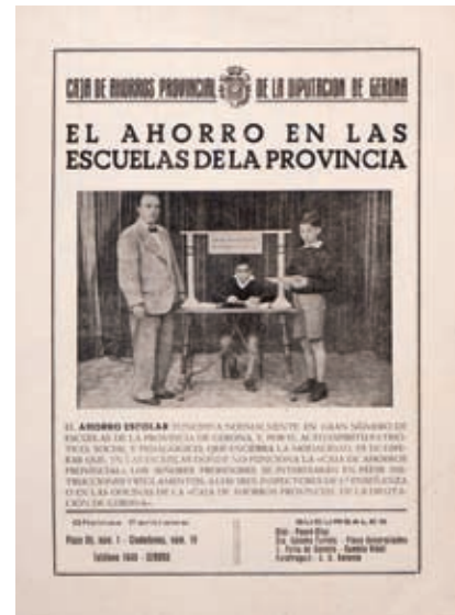
>> Cartell de foment de l'estalvi.

la integració, els respectius consells d'administració de les entitats asseguren que la nova entitat serà més sòlida i més dimensionada, la qual cosa permetrà un major accés als mercats internacionals de capital. La reestructuració implicarà també una important reducció de plantilla (més de 600 persones entre les quatre entitats) i de la xarxa d'oficines.