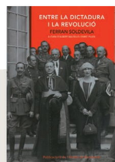
FERRAN SOLDEVILA Entre la dictadura i la revolució Publicacions de l'Abadia de Montserrat. Barcelona, 2009. 296 pàgines.

El projecte «Fem memòria» vol recuperar i deixar testimoni d'una manera de viure, de pensar i de parlar. El llibre inclou un CD on es pot sentir el parlar salat i dites que es van perdent.