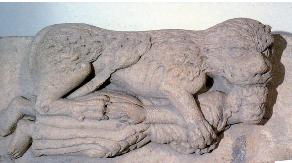
>> El llop del carrer del Llop (en realitat un lleó), relleu del s. XII, actualment al Md'A de Girona.

dades que ara tenen un valor inestimable, i resseguir el que podem qualificar d'autèntica carnisseria.