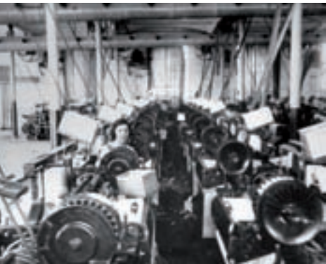
>> La Coma-Cros de Salt, 1910-1936.