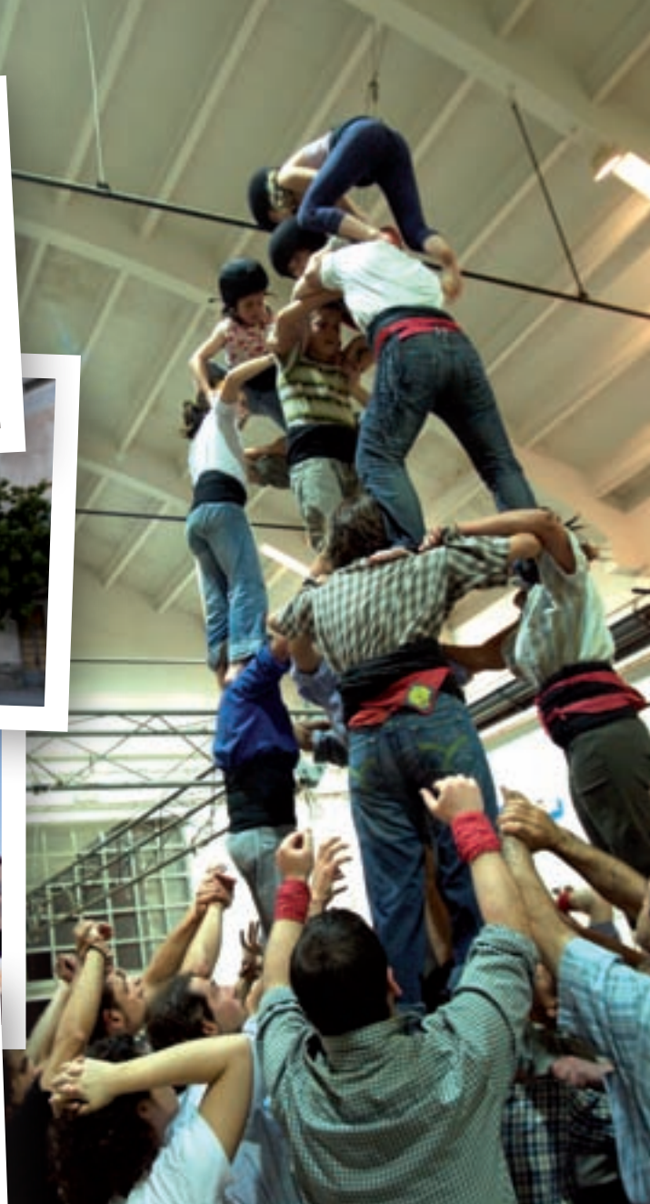
>> De dalt a baix, la Fàbrica de Celrà, la Coma-Cros de Salt, Can Mario de Palafrugell i la Marfà de Girona. A la dreta, assaigs dels Marrecs de Salt a la Coma-Cros de Salt.

destinats a fer possible el miracle econòmic de la producció massiva.