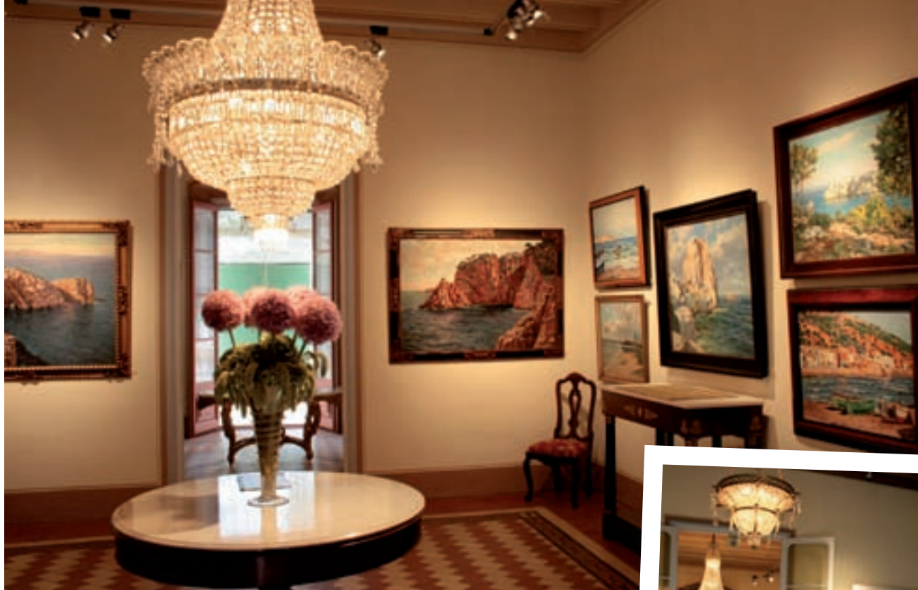
>> L'obra del pintor Mascort omple les sales de la seu de la Fundació.

molt, però també he tingut molta sort. No puc negar que he fet diners. Tinc també un càmping a Castelló d'Empúries i un altre a l'Estartit, amb un petit parc d'atraccions. Fa temps que penso que m'ha arribat el moment de tenir satisfaccions no econòmiques, que són, no es pensi, les satisfaccions més bones.»