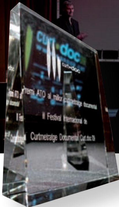
>> Entrega de premis del darrer festival Curt.doc a Vidreres.