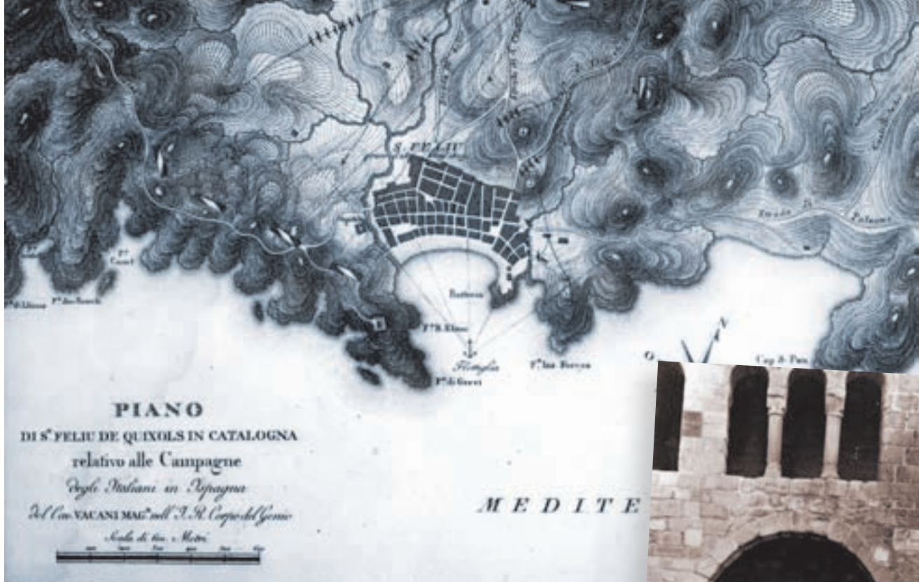
>> Plànol de Sant Feliu fet pel cronista militar Vacani, 1809.

la gent, plenes d'interessos immediats, materials, i apunten vers la víctima principal de la guerra: la població civil.