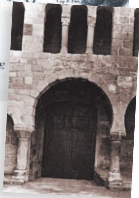
>> Detall de la Porta Ferrada, símbol del monestir benedictí.

El poble de Sant Feliu es trobava dividit en dos bàndols: els partidaris dels religiosos i els partidaris dels liberals