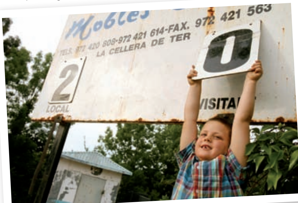
>> L'Aniol Bitlloch canvia el marcador després d'un gol visitant.

ses funcionin de la millor manera, els espanyols es creuen obligats a canviar tot el que puguin. Així, entrenadors que arriben a un modest club que fins aleshores funcionava més bé que malament resulten tenir prou habilitat per enfrontar-se a jugadors, per canviar les alineacions de dalt a baix, per voler aplicar a la tercera regional algun concepte que els sembla haver llegit el dilluns anterior a El Mundo Deportivo i, en fi, per posar en la pitjor de les situacions el club que ha tingut la nefasta idea de contractar-los. Invariablement, no acaben la temporada i són substituïts per algun seu predecessor en el càrrec o per aquell delegat d'equip, aquell encarregat del bar o aquell amic que tornava a passar per allà.