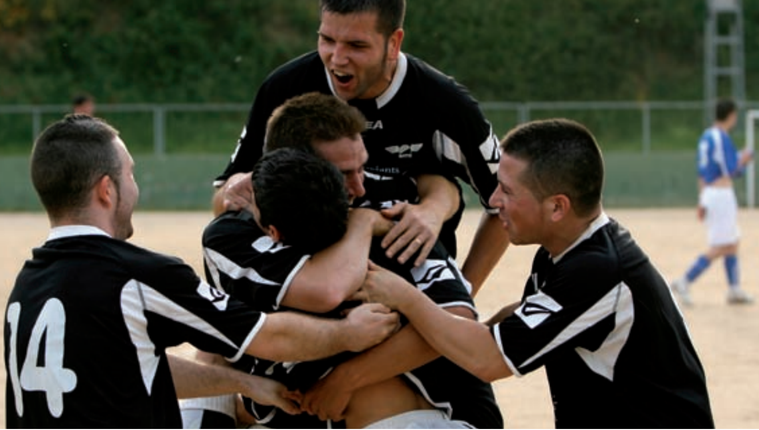
>> Jugadors del Cellera celebrant un gol.

dels misters , i actualment la normativa ha arribat a extrems tan laxos que es poden realitzar gairebé tants canvis com es desitgi. Qui es queda avui sense jugar ni un minut a tercera regional farà bé de repensar-se seriosament si el futbol és el seu esport.