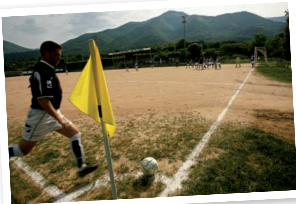
>> Un jugador del Cellera xuta un córner. Vista general del camp municipal.

lota als peus eren artistes. Això –altra vegada– val tant per a tercera regional com per a internacionals.