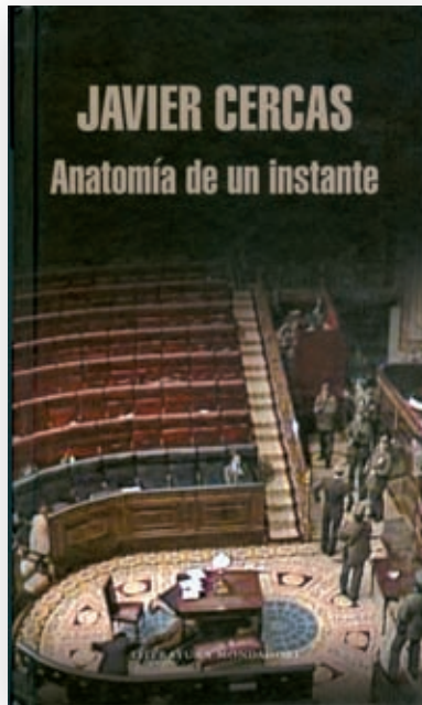
JAVIER CERCAS Anatomía de un instante Literatura, 400. Mondadori. 2009. 463 pàgines.

Anatomía de un instante és la recreació d'un fet històric: la reconstrucció d'un cop d'estat real des de la superfície de les seves imatges enregistrades per TVE i des d'uns interiors polèmics i misteriosos per on es mou l'autor amb l'objectiu de trobar claredat i, sobretot, una explicació. Per poder transmetre aquest afany emprava una estructura impecable i diferents estratègies literàries, com dosis de novel·la negra, gotes de poètiques descripcions i analogies o l'admirable comparació entre dues figures, una real i l'altra fictícia: Adolfo Suárez i Emma-