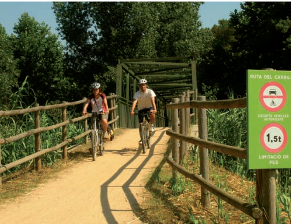
>> Via verda del Gironès: pont sobre l'Onyar.