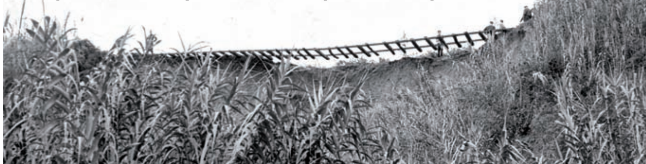
AUTOR DESCONEGUT - FONTS EMB - INSPA I - DIPUTACIÓ DE GIRONA

A final de juliol, un article a La Vanguardia escrit per Narciso Galligans, el pseudònim amb que signava el mateix J. V. Gay en aquell diari, resumia les conclusions dels francesos en uns termes molt positius però acabava, gairebé, amb una amenaça: «por lo tanto, el Ministerio de Obras Públicas, dada la trascendencia, no dudará en aprobarlo. Lo otro sería un contrasentido». Per les Fires de l'any 1966, des de Los Sitios , Gay tornava sobre l'afer amb un text que duia per títol: «¿Las últimas ferias con "els trens petits"?». Un altre cop defen-