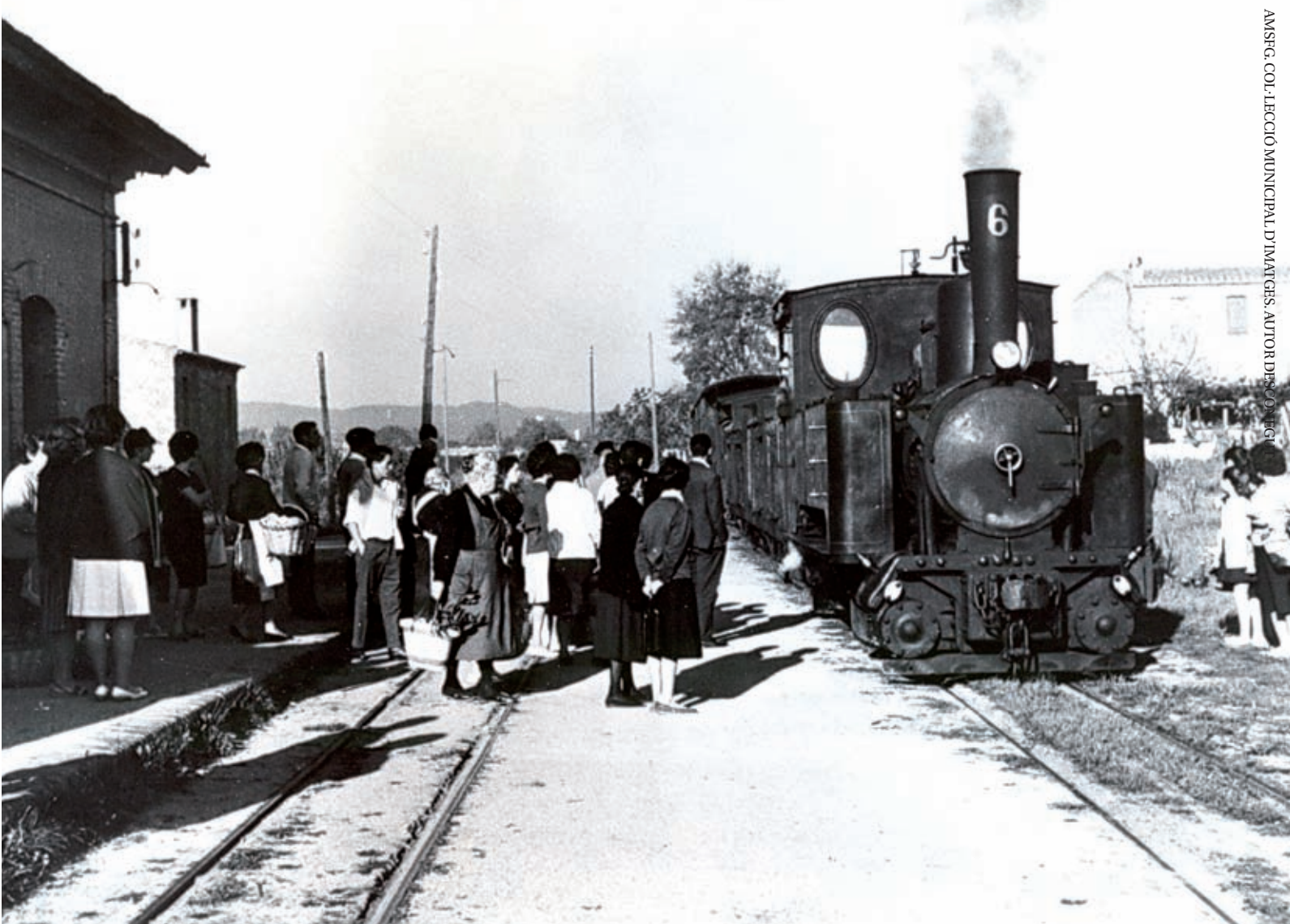
>> Estació del tren de Sant Feliu a Santa Cristina d'Aro.

que se'ls abonessin els deutes contrets amb anterioritat per la insuficiència de les subvencions. Tot i això, van continuar retenint la titularitat nominal de l'empresa, la qual cosa també va tenir, anys a venir, conseqüències per als petits trens gironins quan els antics propietaris passaren a fer-los la competència des de la carretera.