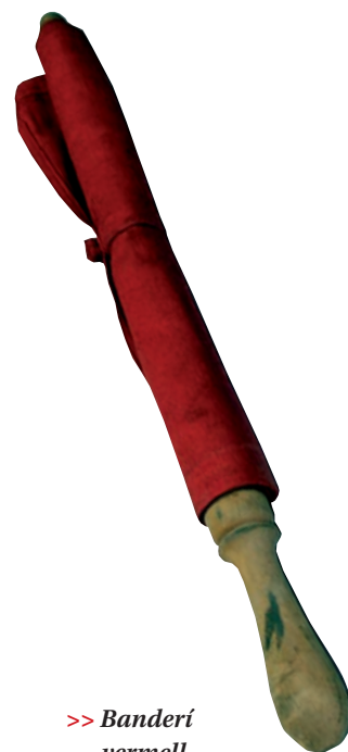
>> Banderí vermell.

>> Les cues de cotxes sovintejaven a la Girona dels anys seixanta per culpa dels passos a nivell.