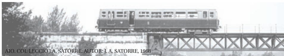
AIO. COL·LECCIÓ J.A. SATORRE. AUTOR: J. A. SATORRE, 1968