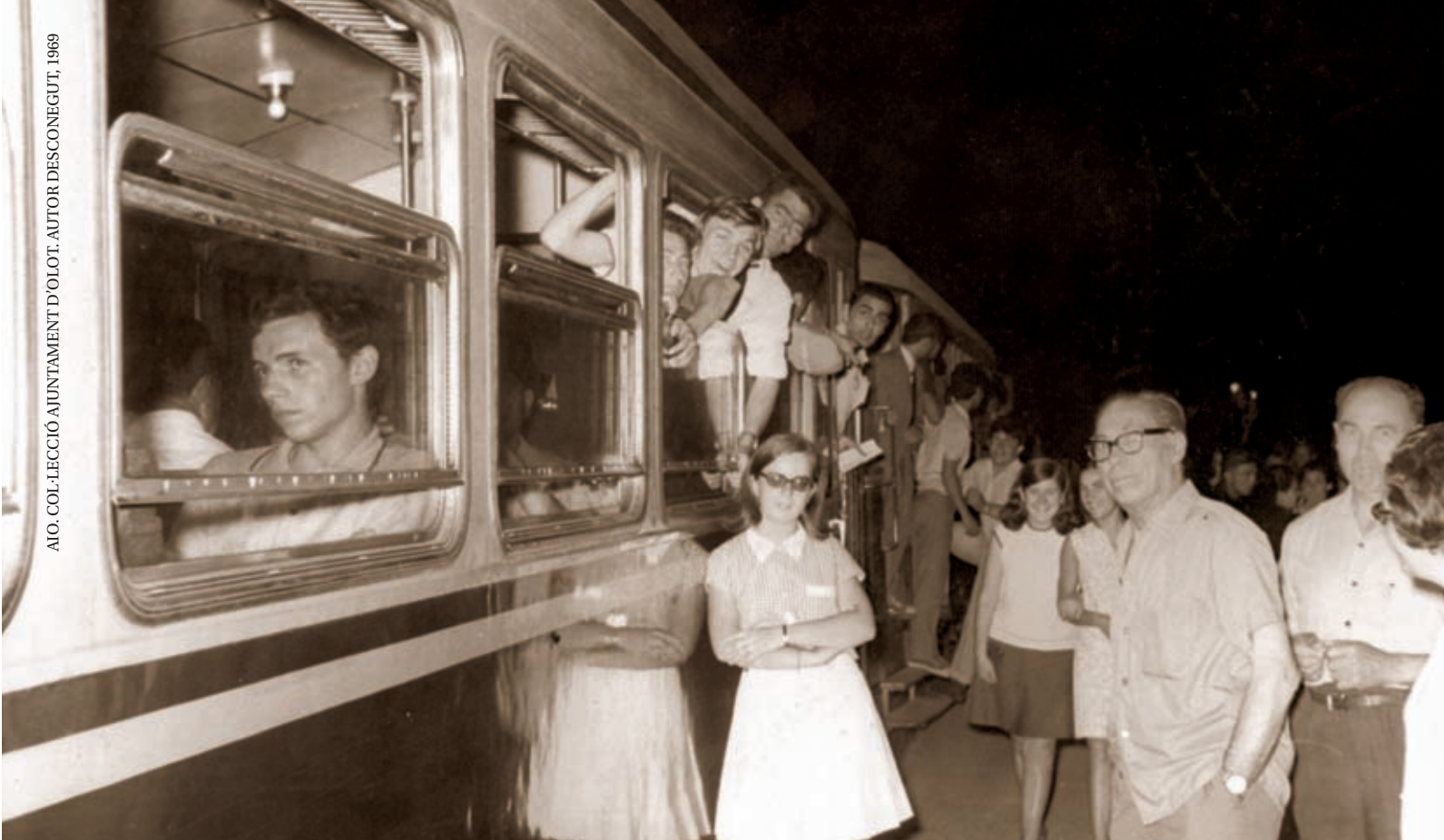
>> Darrer viatge del tren d'Olot, el 15 de juliol de 1969.

tat i el va presentar el mes de juny. El dia 22 de juliol la Comissió Especial de la Diputació en va informar el ple, que decidí per unanimitat enviar-lo a la Direcció General de Transports Terrestres perquè en tingués coneixement i alhora expressar l'agraïment de la Diputació: «agradecer profundamente al Excmo. Sr. Director de Transportes Terrestres la protecció que ha venido dispensando a la explotación de dichos ferrocarriles haciendo posible su supervivencia».