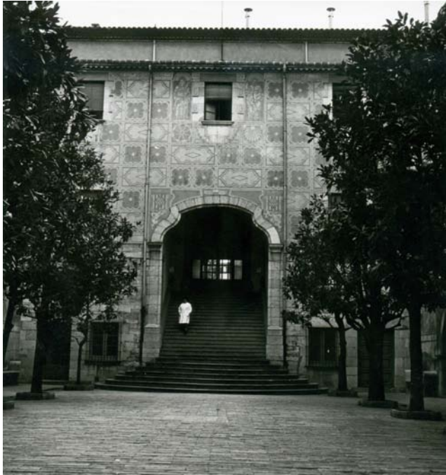
Pati central de l'Hospital de Santa Caterina de Girona (c.1970).