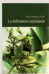
CARLES MCCRAGH I PRUJÀ La infermera tunisiana Leonard Muntaner Editor. Palma de Mallorca, 2008. 98 pàgines.

mesos i fins anys abans de ser afusellat en un tram de la carretera N-II, terme municipal de Fallines, el 25 d'agost del 1936. Els «revolucionaris» de Salt el tenien a la llista negra per la seva condició de membre destacat de la Federació de Joves Cristians de Catalunya (FJCC). El consideraven un enemic declarat de la República laica i atea que ells volien implantar, i ell havia fet mèrits per congriar el seu odi, en encarar-se públicament amb alguns blasfems i malparlats. Això era fruit de la seva fe viva i compromesa.