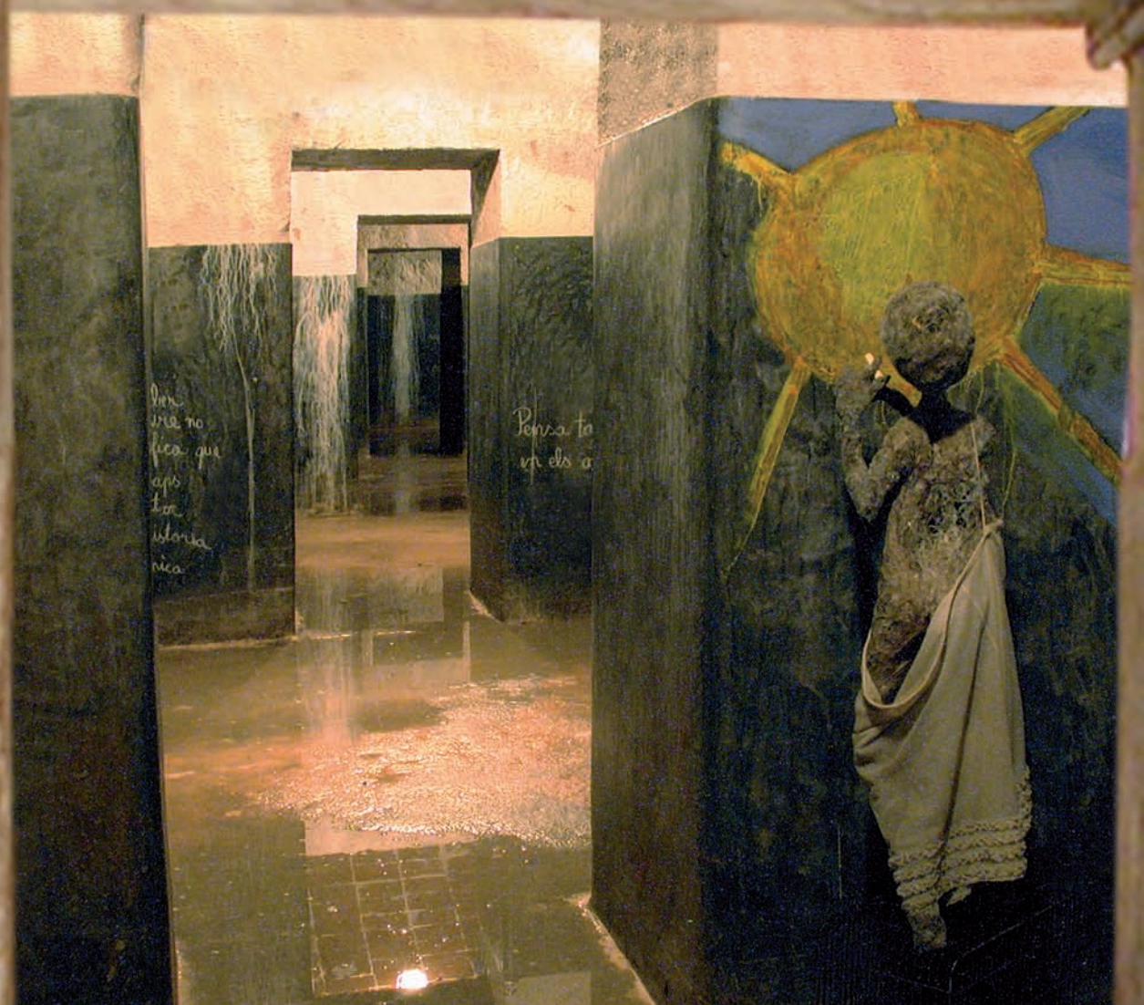
>> Fotomuntatge del Jardí de la Infància i l'interior del refugi.