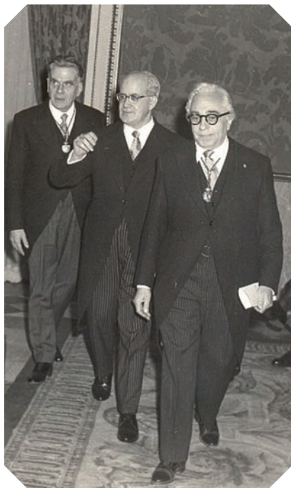
>> Investit com a acadèmic de la Reial Acadèmia de Sant Jordi de Barcelona.