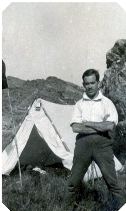
>> Subias, jove i esportista, va recórrer el país.