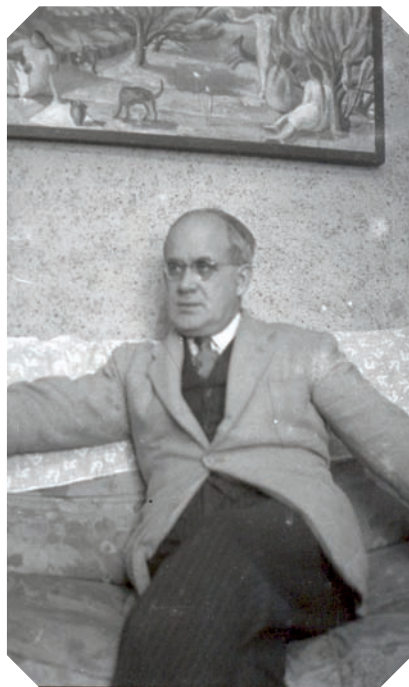
>> Subias en una fotografia de plena maduresa.