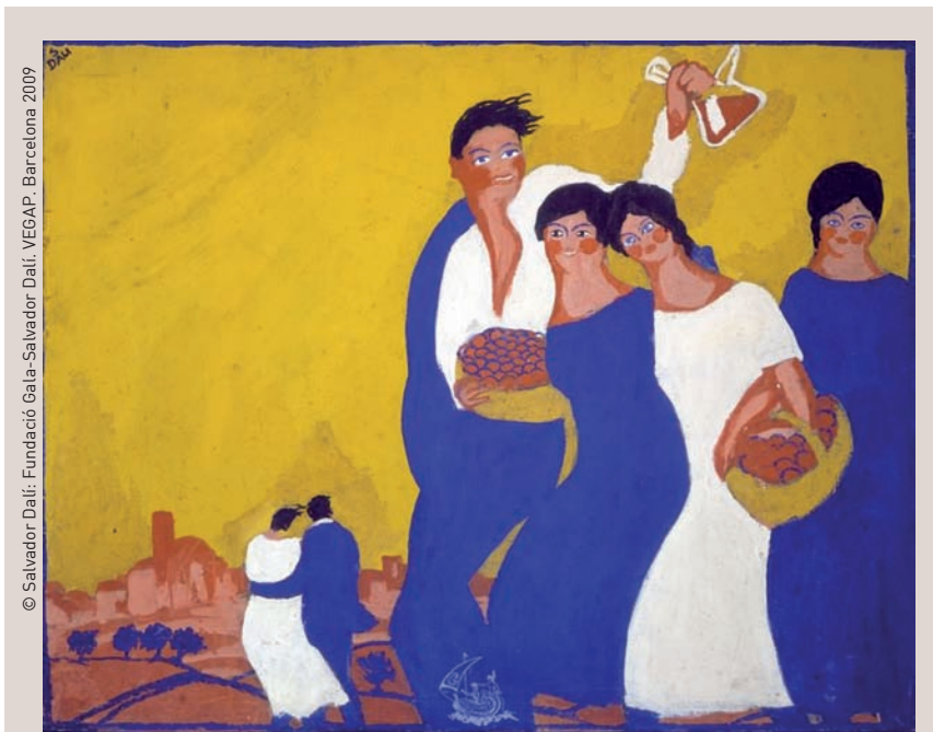
>> Cartell de Salvador Dalí per a les Fires i Festes de la Santa Creu de l'any 1921.