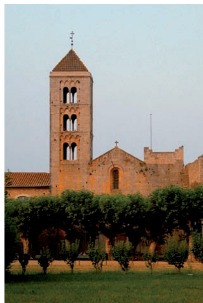
>> Església romànica de Santa Maria de Vilabertran.