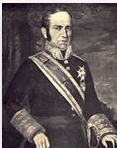
>> General en cap de l'exèrcit espanyol Joaquín Blake y Joyes.

D'altra banda, Enrique José O'Donnell va adquirir gran fama durant els dos