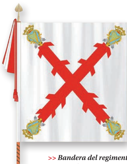
>> Bandera del regiment Ultònia 1808-1809.

meitat (4.000 habitants). Hom calcula al voltant d'unes 10.000 el nombre de baixes (entre civils i militars) que es varen produir muralles endins, entre les quals 601 van ser de soldats irlandesos (550 de pertanyents al regiment d'infanteria Ultònia i 51 granaders del regiment Hibernia).