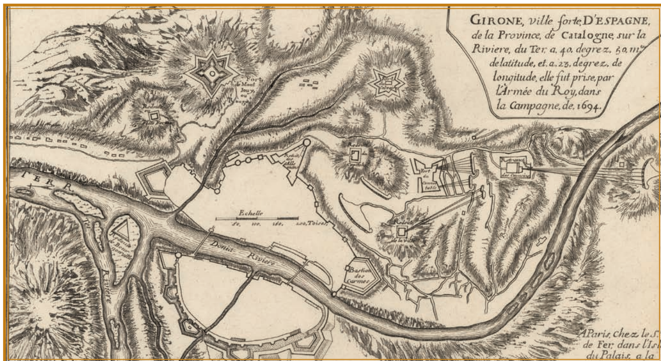
>> Gironne, ville forte d'Espagne. Mapa de Girona del 1694.

de la població, i es va recórrer al consum de carn de cavall, d'ase, de gos, de gat i de ratolí, carn que es pagava a preu d'or. En els monestirs ja només es consumia pa i aigua, i molts religiosos començaren a fugir de la ciutat, mentre els jesuïtes socorrien els malalts i afligits.