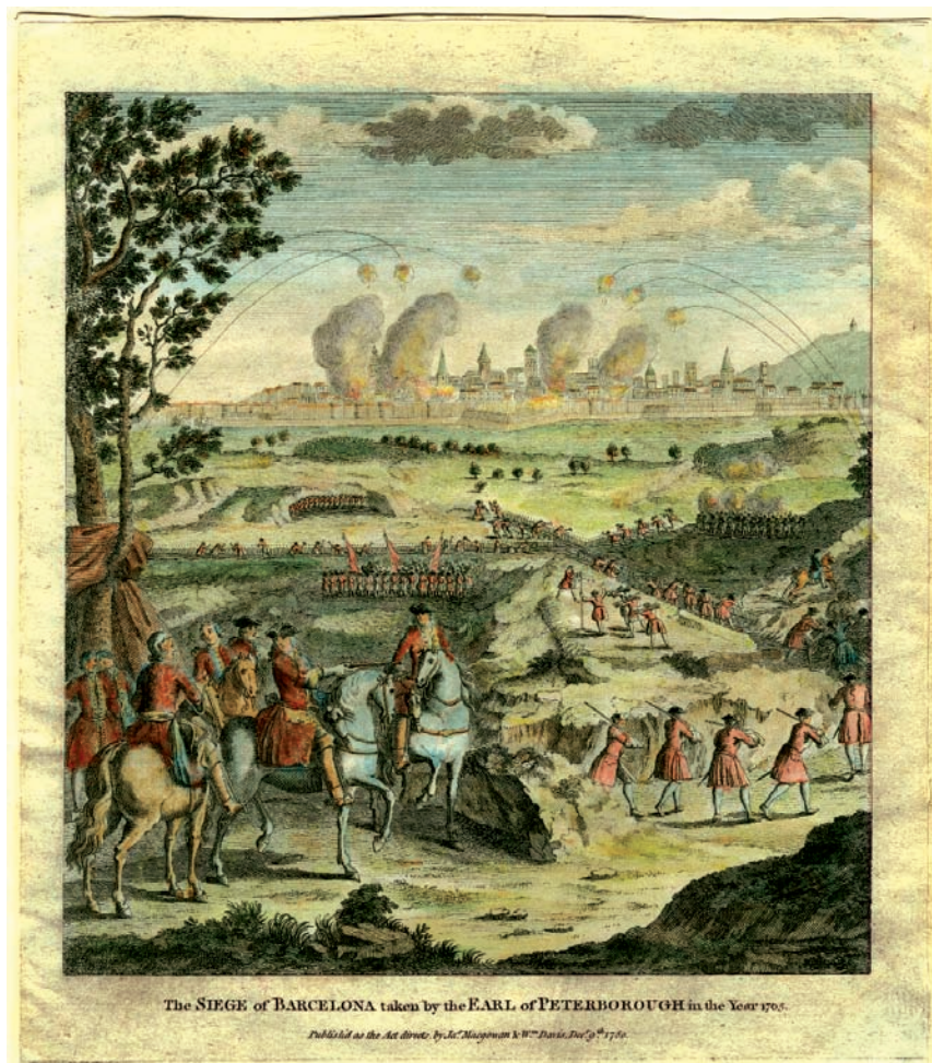
1780. Gravat. Providence: Anne S. K. Brown Military Collection.

El dia de Nadal de 1710 començà el bombardeig sobre el fort de Montjuïc i el carrer de Pedret (per mirar d'abatre la porta de Santa Maria). La manca de queviures es posà aviat de manifest. L'elecció d'atacar la principal defensa exterior de la ciutat de Girona estigué motivada per trobar-se en la mateixa línia d'operacions francesa, i per tant quedava més a l'abast. Les altres opcions, com ara des del camí de Barcelona o la riba dreta del Ter, no foren considerades gaire factibles a causa de les possibles sortides de la guarnició. El dia 29, els assetjadors es feren amos de Montjuïc, i el 30 s'apoderaren de la zona de Pedret. La guarnició de Girona, inquieta pels treballs francesos en el barri gironí, atacà aquest reducte. A primers de 1711 l'artilleria cessà la seva feina a causa d'un fort temporal de pedra i pluja. Les tropes franceses situades al pla de Girona quedaren atrapades per la crescuda dels rius Onyar, Ter i d'altres recs, i els soldats passaren vint dies dins les trinxeres plenes d'aigua. Fins i tot alguns caporals opinaren que era millor aixecar el setge i tornar per la primavera. El duc de Noailles, en canvi, perfeccionà la línia de circumval·lació, per la qual havien aconseguit passar alguns reforços en direcció a la ciutat. Durant la intensificació del setge, tropes franceses que actuaven al sud de Girona robaren a l'església parroquial de Campllong i esquinçaren els llibres baptismals.