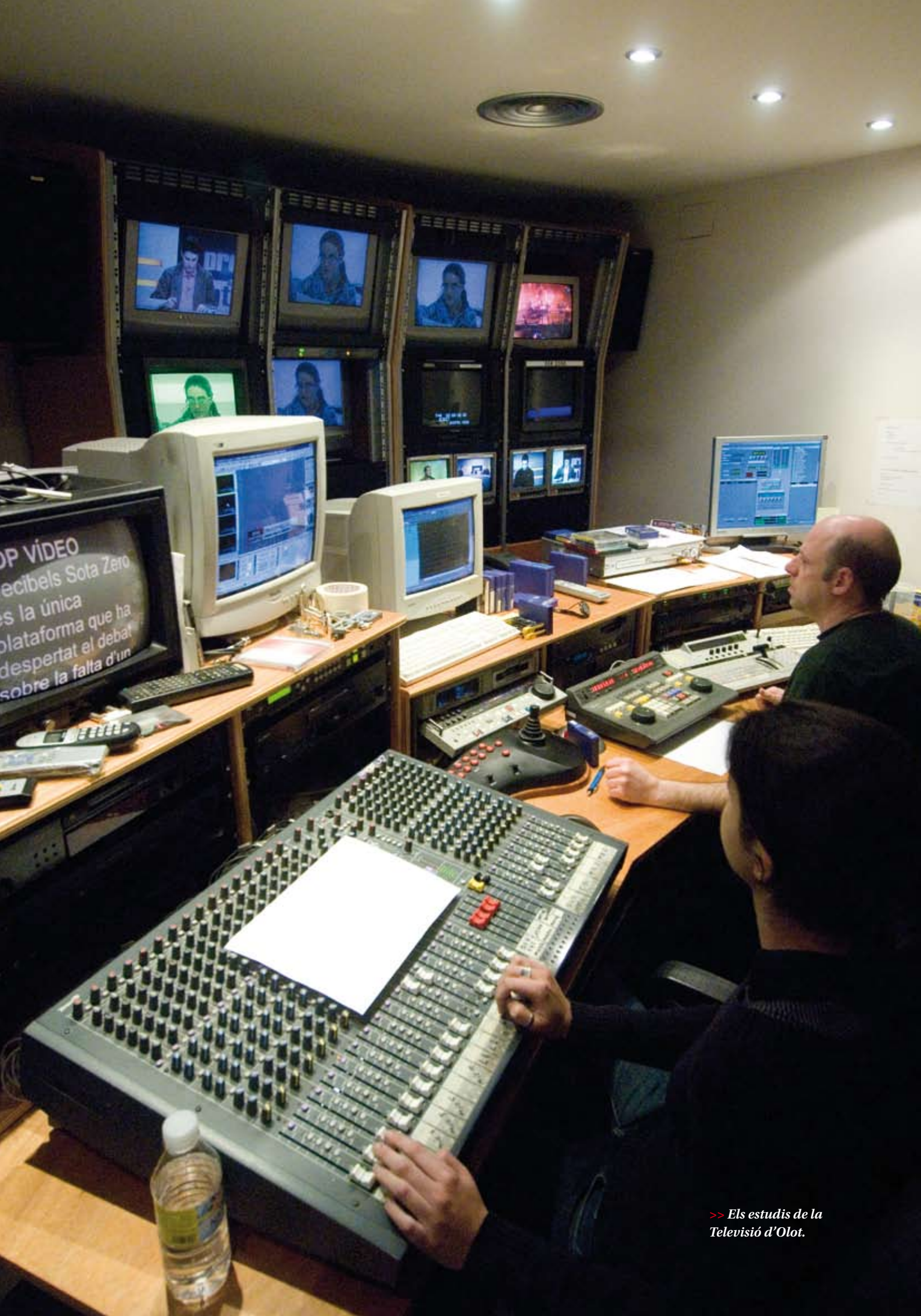
>> Els estudis de la Televisió d'Olot.