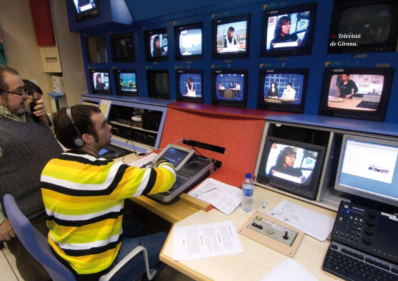
>> Televisió de Girona.