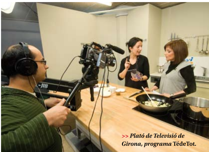
>> Plató de Televisió de Girona, programa TèdeTot.

A les comarques gironines hi ha tretze televisions locals, totes amb arrelament al territori i amb una programació propera a la realitat que els envolta