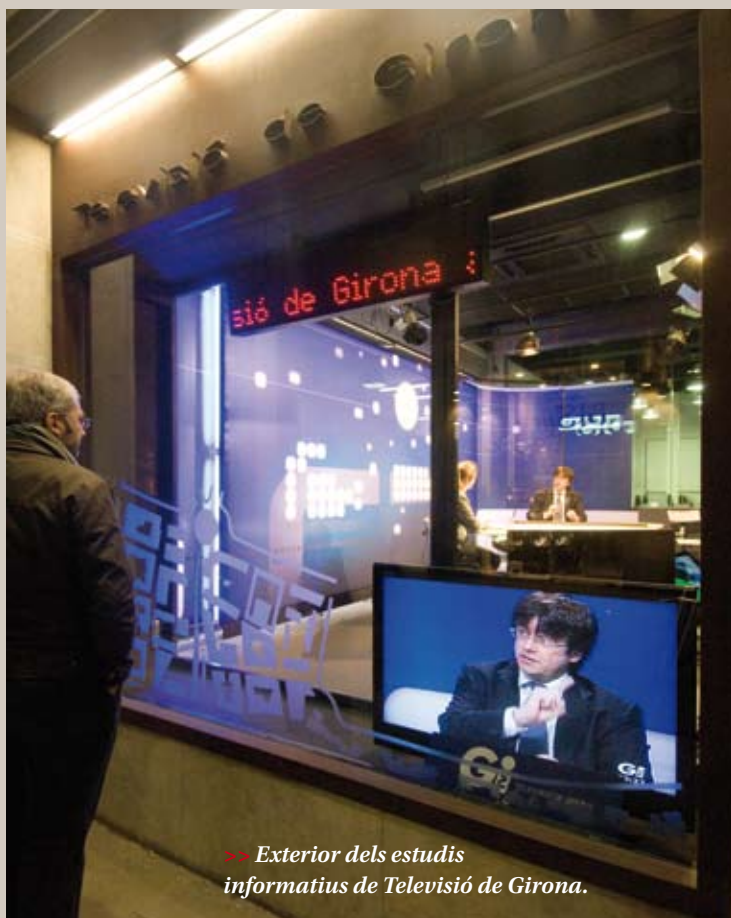
»» Exterior dels estudis informatius de Televisió de Girona.

Els consumidors de televisió tenen a l'abast molts canals gràcies a la TDT. I, entre tots aquests canals, que aniran a més, hi ha les televisions locals. L'audiència dels canals es repartirà força, per la qual cosa els canals de proximitat esdevindran canals de zapping, canals amb un consum pocs minuts. Però per aconseguir guanyar espai és necessari que aquestes televisions adaptin la seva programació a allò que espera el teleespectador. Fins ara, tot i que la informació local és la més demanada, les cadenes dediquen poc més d'una hora al dia, en el millor dels casos, a informatius de proximitat. La resta, i els costos en tenen bona part de culpa, són continguts generalistes –a voltes adaptats a la realitat local-. Així, trobem programes de cuina, de cinema, d'esports, culturals o, fins i tot, pel·lícules. Cal adaptar els continguts més propers a un consum més curt en quant a minuts sense renunciar a jugar un paper important en el món local. El mateix paper que ha trobat la premsa local enfront dels grans diaris d'abast nacional. Un altre opció que també pot tenir sentit és tematitzar l'oferta de continguts tenint en compte que hi haurà diversos canals locals confluint en un mateix múltiplex. Són apostes innovadores, també arriscades, però que permetran fer-se un forat en l'amplia oferta que arribarà a totes les llars