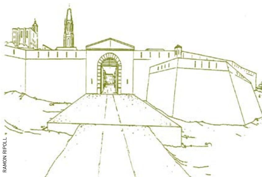
>> Representació de la porta de França (reformada a la segona meitat del segle XIX), per on Oller va fugir de Girona.

en detall com els francesos prepararen el segon setge traslladant bombes i bateries des de Bàscara fins a Medinyà (final d'abril de 1809) i atrinxerant-se a l'entorn de Girona (8 de maig 1809), i com van iniciar l'atac amb foc de morter, canó i obús (principi de juny de 1809). Oller comenta les seves freqüents anades i vingudes des del despatx del governador al despatx de la Junta de Girona. És interessant remarcar que, segons l'autor del document, el governador treballava en la seva habitació ordinària en comptes d'utilitzar el refugi blindat que tenia a casa seva. Sorpren novament el comentari d'Oller en afirmar que Álvarez de Castro no prenia cap decisió important sense consultar-l'hi, una afirmació que hauríem de relacionar, i fins i tot coresponsabilitzar-ne al nostre cronista, amb la decisió del governador de no admetre cap més parlamentari francès (2 de juliol de 1809). Oller també recorda la seva actitud optimista en totes les reunions de la Junta de Girona.