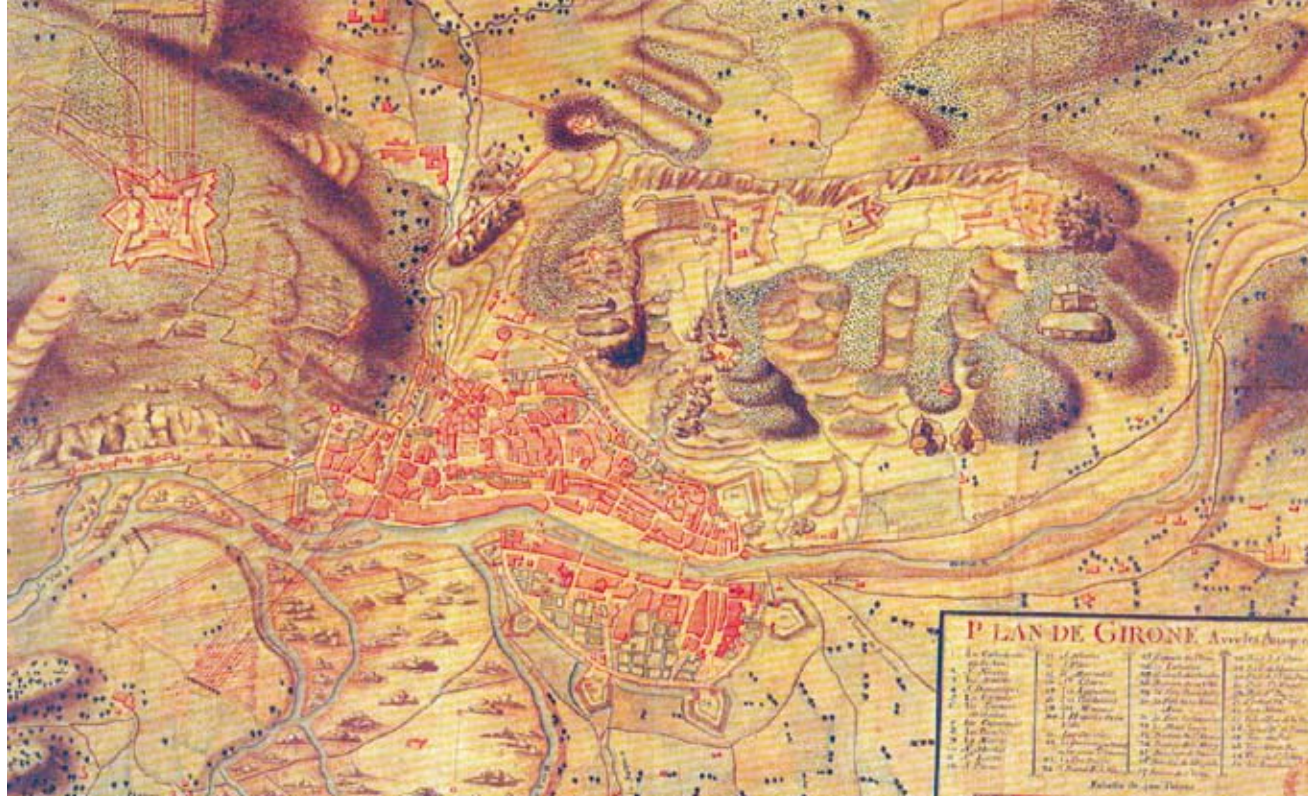
>> Mapa militar de la ciutat de Girona (1809, aprox.).