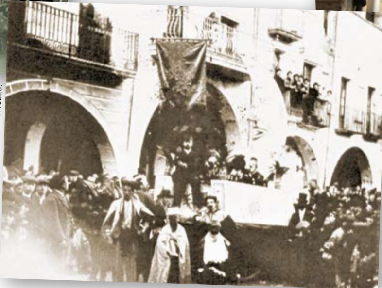
>> Teiera de ferro a la façana de can Bòlica.