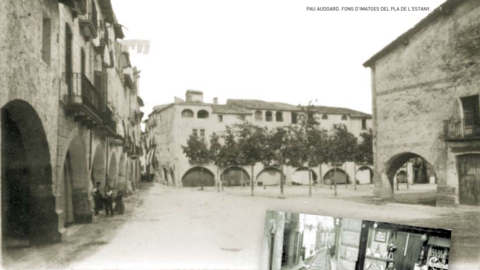
>> Primera fotografia coneguda de la plaça Major, cap a l'any 1890.