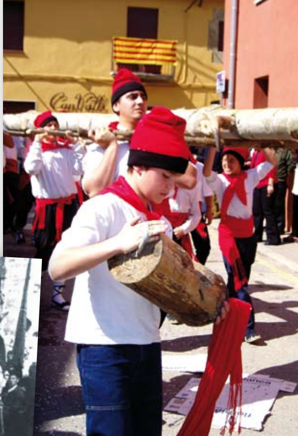
MIQUEL RUSTULET. FONS D'IMATGES DEL PLA DE L'ESTANY