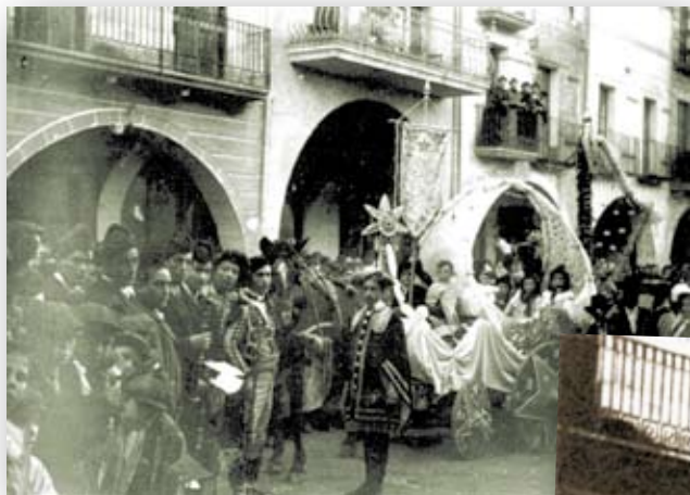
>> Dues imatges de la Rua de Carnestoltes a començament del segle xx.