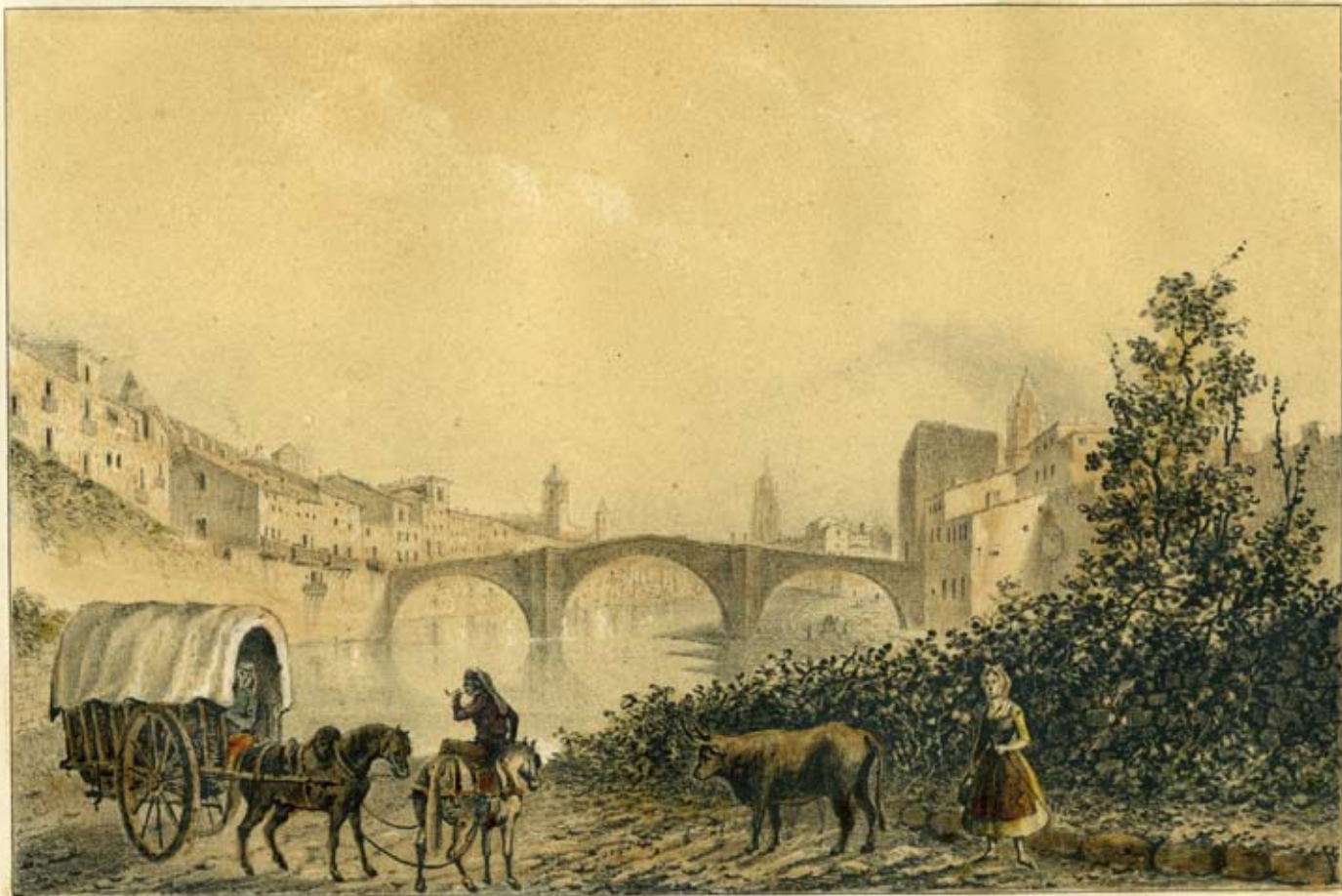
Dibuixado del natural y litó por E.J. Parcerisa.