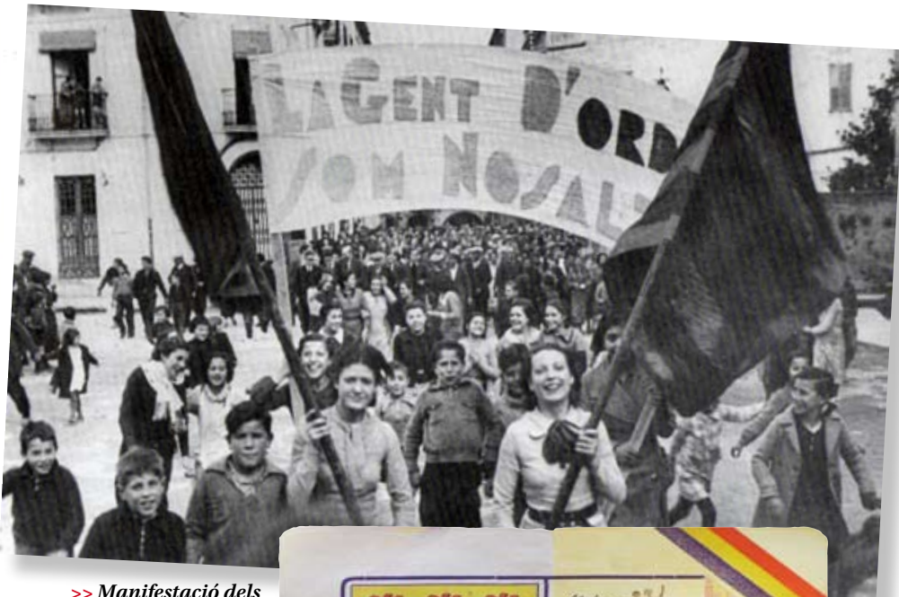
>> Manifestació dels republicans d'esquerra a Banyoles (febrer, 1936).