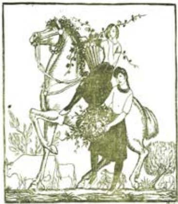
EMPORDÀ FEDERAL FIGUERES LA DELS BELLS MERCATS