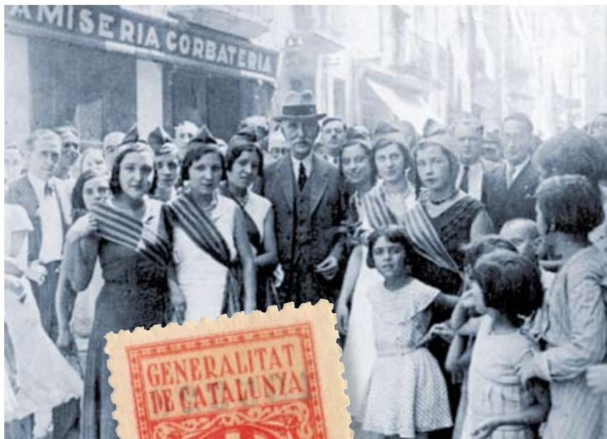
>> Pòlissa de la Generalitat republicana.