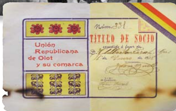
>> Carnet de la Unió Republicana d'Olot.

llarg del primer terç del segle XX es produí una progressiva fusió entre els ideals republicans i els plantejaments catalanistes i esquerrans. Això féu que els principals partits republicans es definissin políticament com a hereus d'aquesta triple tradició. No ha de sobtar, doncs, que el principal partit que dirigí la institucionalització republicana dels anys trenta es digués precisament Esquerra Republicana de Catalunya. I tampoc no ha de sobtar que el seu principal dirigent, Francesc Macià (de qui enguany es commemora el 150è aniversari), proclamés, el 14 d'abril del 1931, la República catalana, en un acte de sobirania política sense precedents en la història de la Catalunya contemporània. Naturalment fou un acte polític molt controvertit, però a ulls d'ara és fora de dubte que sense aquest gest polític de Macià no es po-