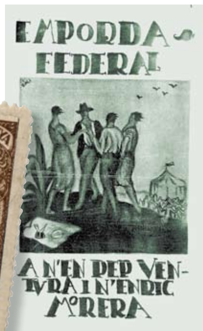
>> Portada de l'òrgan dels republicans empordanesos il·lustrada per Salvador Dalí.