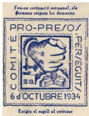
>> Segell d'ajut pro-presos del 6 d'octubre de 1934.