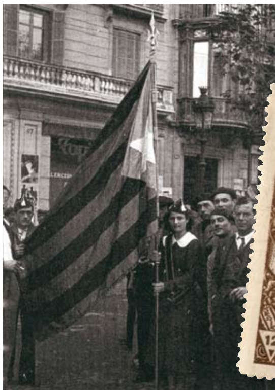
>> Proclamació de la República catalana a Girona (abril, 1931).