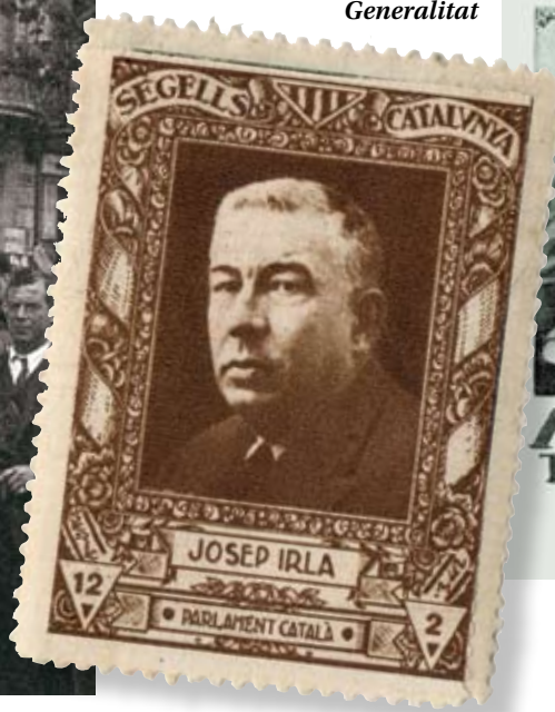
>> Segell dedicat a Josep Irla, dirigent d'ERC i tercer president de la moderna Generalitat